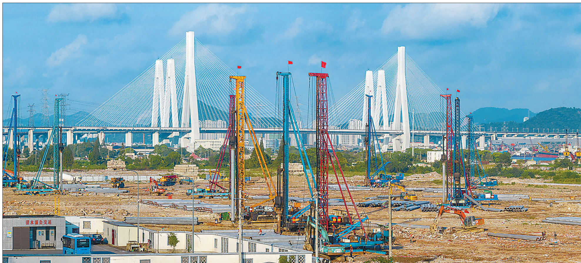
8月5日,浙江省宁波东方理工大学永久校区一期进入场地平整、桩基施工等阶段。据悉,该学校为宁波市筹建的新型研究型大学,校区位于宁波市镇海区清水浦片区,整体分三期建设。按计划,学校将于2025年开始招收本科生,规划在校生规模为1万人。