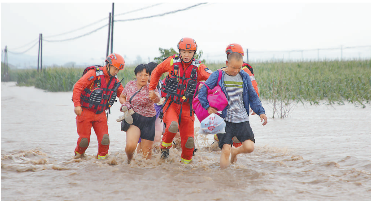
8月4日,吉林省吉林市森林消防支队的消防救援人员在舒兰市七里乡转移受灾群众。