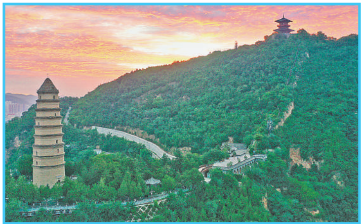
陕西延安,宝塔山绿意盎然。

在近日召开的全国生态环境保护大会上,习近平总书记强调,经过顽强努力,我国天更蓝、地更绿、水更清,万里河山更加多姿多彩。从今日起,本报推出“新时代画卷·多姿多彩 万里河山”系列视觉版,生动反映新时代我国生态文明建设取得的巨大成就,多角度展现我国良好的生态环境和多姿多彩的万里河山,聆听全面推进美丽中国建设的铿锵足音。——编者