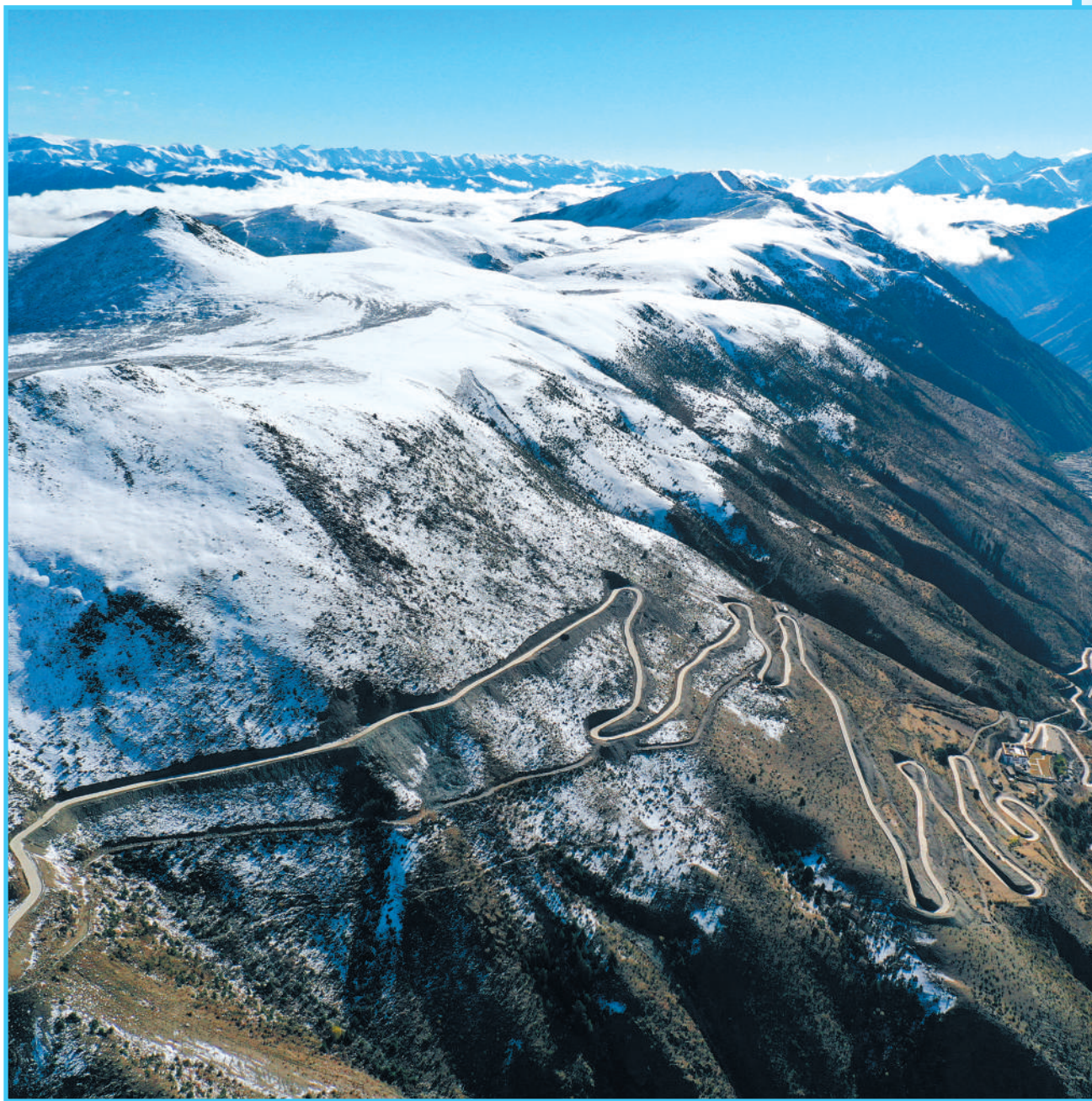
上图:西藏自治区察雅县浪拉山雪后风光。