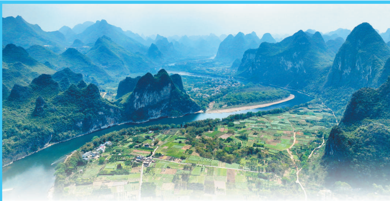
广西壮族自治区桂林市阳朔县,漓江蜿蜒曲折,风光旖旎。

在近日召开的全国生态环境保护大会上,习近平总书记强调,经过顽强努力,我国天更蓝、地更绿、水更清,万里河山更加多姿多彩。从今日起,本报推出“新时代画卷·多姿多彩 万里河山”系列视觉版,生动反映新时代我国生态文明建设取得的巨大成就,多角度展现我国良好的生态环境和多姿多彩的万里河山,聆听全面推进美丽中国建设的铿锵足音。——编者