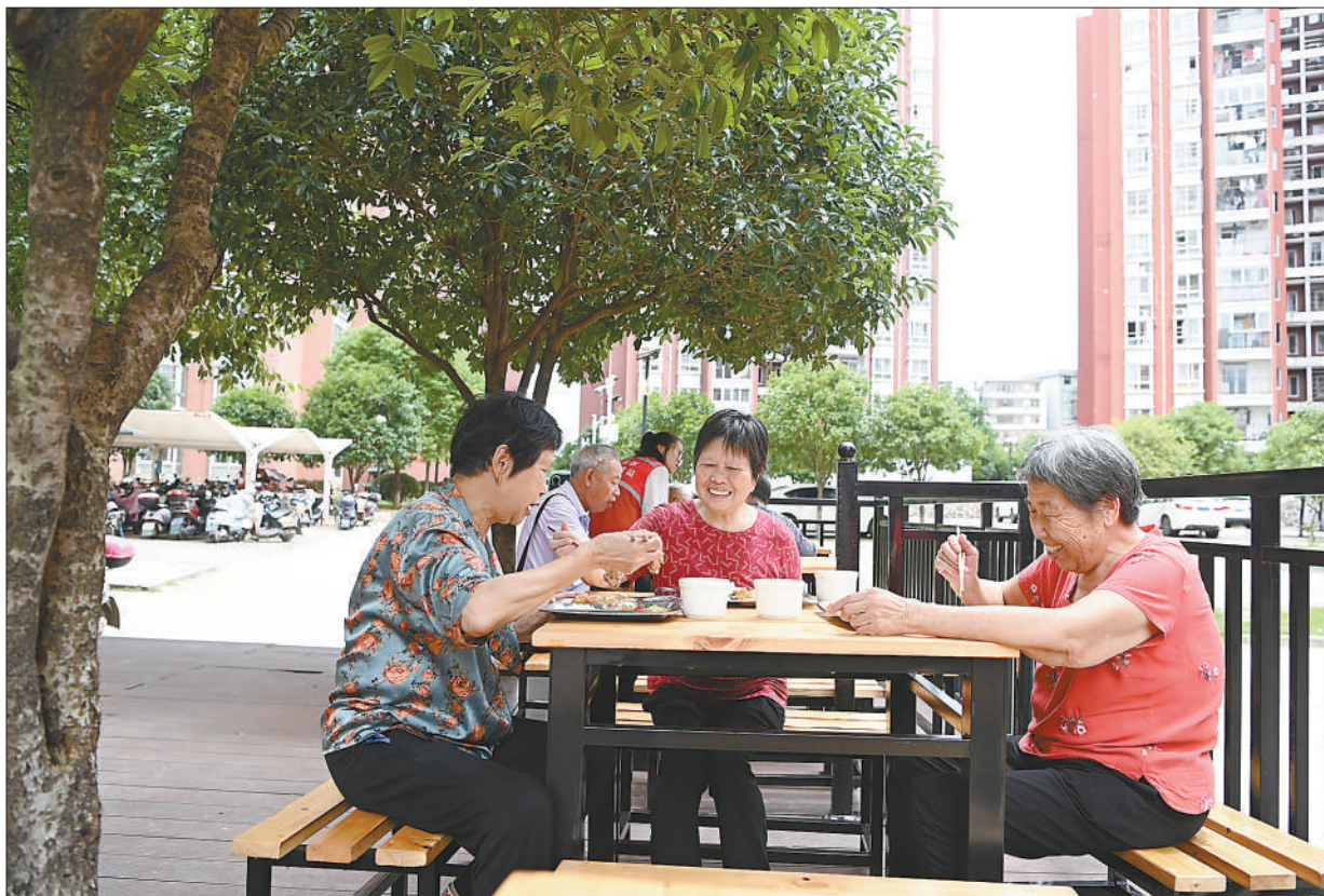
孝老食堂暖心服务

据了解，从检察办案情况看，内部人员犯罪案件背后都不同程度存在公司治理体系不健全、财务管理混乱、内部防范机制缺失、从业人员法治观念淡薄等问题。民营企业加强自身合规建设，完善防范内部人员犯罪的制度机制，是从源头上保护自身合法权益的根本举措。