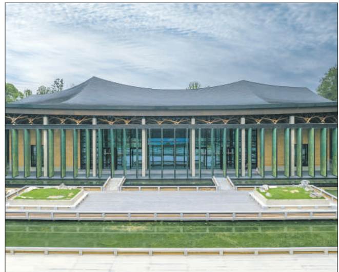
▲中国国家版本馆杭州分馆外景。