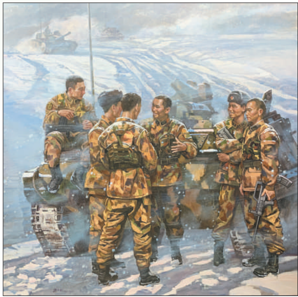
▲油画《风雪青春》，作者孙立新。