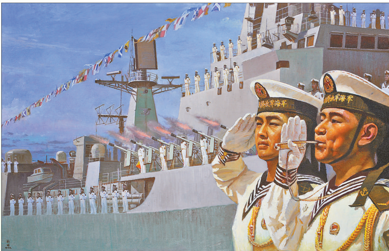
▼油画《水兵》，作者周补田。