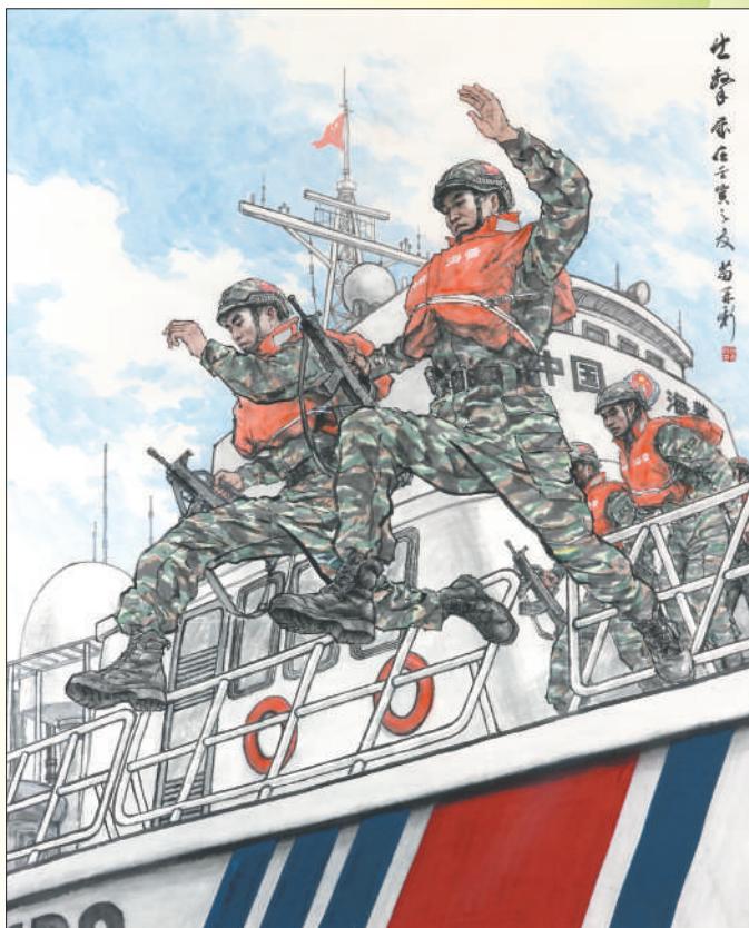
▲中国画《出击》，作者苗再新。