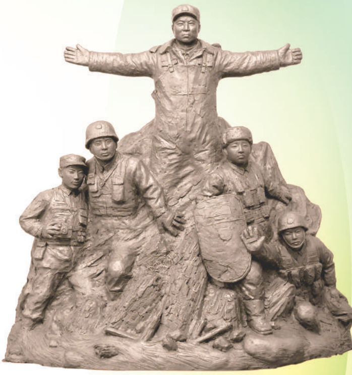
▲雕塑《山河》，作者何鄂。