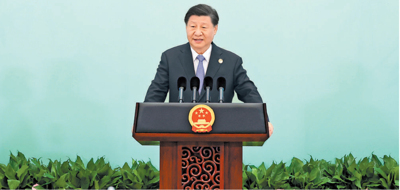
7月28日中午，国家主席习近平和夫人彭丽媛在四川省成都市金牛宾馆举行宴会，欢迎出席成都第31届世界大学生夏季运动会开幕式的国际贵宾。这是习近平发表致辞。

欢迎宴会 WELCOMING BANQUET 成都第31届世界大学生夏季运动会 CHENGDU FISU WORLD UNIVERSITY GAME CHINA 20