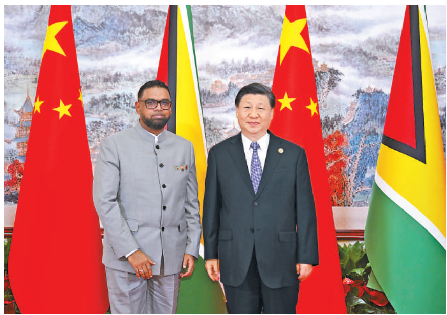
7月28日上午，国家主席习近平在成都会见来华出席第31届世界大学生夏季运动会开幕式并访华的圭亚那总统阿里。

习近平指出，2013年我首次访问加勒比地区，同加勒比9个建交国领导人一道确立中加全面合作伙伴关系。中方一贯支持加勒比国家团结自强、发展繁荣，愿同加方携手构建更加紧密的中加命运共同体。希望圭方继续为中国同加勒比国家关系发展发挥积极作用。