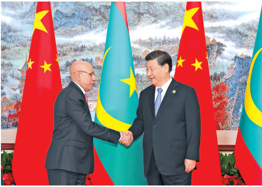
7月28日下午，国家主席习近平在成都会见来华出席第31届世界大学生夏季运动会开幕式并访华的毛里塔尼亚总统加兹瓦尼。