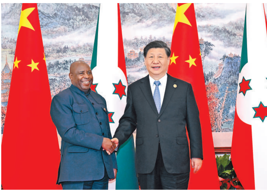
7月28日下午，国家主席习近平在成都会见来华出席第31届世界大学生夏季运动会开幕式并访华的布隆迪总统恩达伊施米耶。