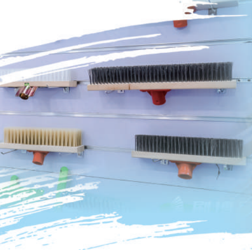
图③：村民在家加工刷子。

源潭并非刷业的源头。源潭人的制刷手艺，是从邻近桐城的青草镇等地“偷学”而来。但现在，源潭刷业早把其他地方甩在后面。这不禁引起我们另一个疑