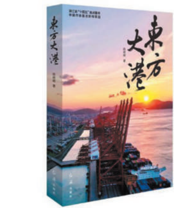
《东方大港》：陈崎嵘著；红旗出版社出版。

经过奋斗者的不懈努力，宁波舟山港完成“第一次创业”“第二次创业”，并在新时代新征程上向着数字化、智能化的现代化港口开始“第三次创业”。作品要书写和展示的，正是海港腾飞背后感人的中国故事和强大的中国力量。