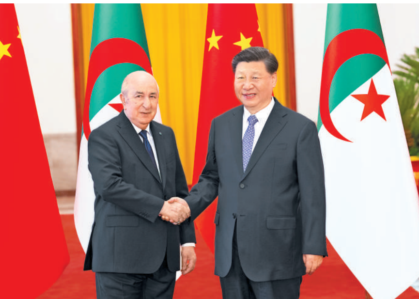
7月18日下午,国家主席习近平在北京人民大会堂同来华进行国事访问的阿尔及利亚总统特本举行会谈。这是会谈前,习近平在人民大会堂北大厅为特本举行欢迎仪式。

特本表示,中国是阿尔及利亚最重要的朋友和伙伴。感谢中方长期以来向阿方提供各种宝贵支持,阿方坚定支持中方在台湾、涉疆等核心利益问题上的立场,支持中方提出的全球发展倡议、全球安全倡议、全球文明倡议,愿积极参与共建“一带一路”,深化中阿全面战略伙伴关系, (下转第四版)