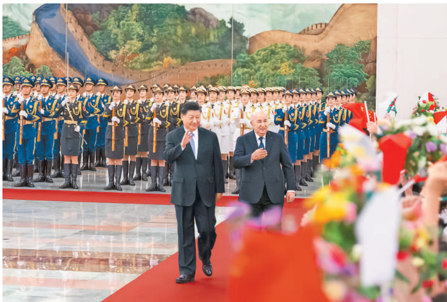
7月18日下午,国家主席习近平在北京人民大会堂同来华进行国事访问的阿尔及利亚总统特本举行会谈。这是会谈前,习近平在人民大会堂北大厅为特本举行欢迎仪式。