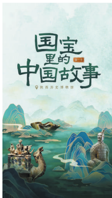
图为微纪录片《国宝里的中国故事》海报。

文物是以小见大展现中华文明的巧妙切口。微纪录片《国宝里的中国故事》选取西周至五代时期的6组国宝文物,探寻背后的历史故事。该片每集以一件文物为中心,从小切口进入大历史,横向关联其他文物,纵向梳理历史脉络,探寻文物蕴藏的时代气象,呈现其中跨越时空的精神内核。青铜器日己夔纹双羊尊,绵延不绝的中华文明始终包含一个“礼”字;秦始皇陵跪射俑坚毅的表情,透露着沉着英勇;唐代鎏金兽首玛瑙杯别具风情,折射开放包容的大唐气度……作为一档面向少年儿童的文博科普纪录片,作品充分考虑受众接受程度,通过有趣的旁白和俏皮的动画特效让文物生动可感,将文化内涵娓娓道来,深入浅出、举重若轻。同时,作品视听语言的专业程度不因受众年龄而有所下降,无论是画面质感还是内容架构,都可圈可点。