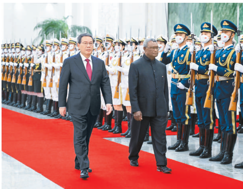
7月10日上午,国务院总理李强在北京人民大会堂同来华进行正式访问的所罗门群岛总理索加瓦雷会谈。这是会谈前,李强在人民大会堂北大厅为索加瓦雷举行欢迎仪式。

李强强调,中方理解太平洋岛国在气候变化问题上的特殊处境和重大关切,将继续同所方加强应对气候变化南南合作,提升岛国自主发展和应对风险能力。中方愿同所方共同坚持真正的多边主义。 (下转第三版)