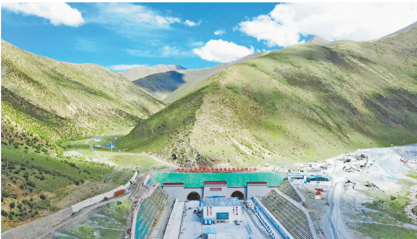
西藏自治区S5线(拉萨至泽当快速通道)的关键工程主嘎拉隧道历时7年建设,日前全线贯通。主嘎拉隧道平均海拔4300米,隧道左洞长12.79公里,右洞长12.78公里,是目前世界最长的超海拔公路隧道。隧道的贯通为西藏S5线全线年底通车奠定了基础。通车后,拉萨至山南的车程将缩短至1小时,方便当地群众出行,带动沿线旅游和农牧产业发展。图为主嘎拉隧道入口。

习近平总书记指出:“乡村振兴,既要塑形,也要铸魂,要形成文明乡风、良好家风、淳朴民风,焕发文明新气象。”完善党组织领导的自治、法治、德治相结合的乡村治理体系,创新乡村治理方式,提高乡村善治水平,必能让农村既充满活力又稳定有序。