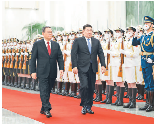
6月28日上午，国务院总理李强在北京人民大会堂同来华进行正式访问的新西兰总理希普金斯会谈。这是会谈前，李强在人民大会堂北大厅为希普金斯举行欢迎仪式。