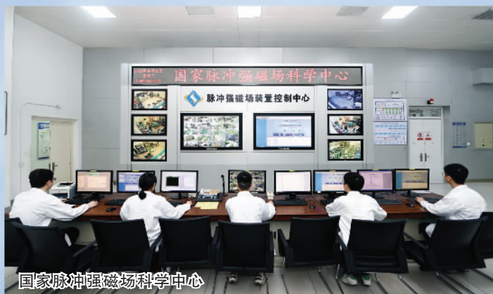
国家脉冲强磁场科学中心

近一年，九峰山实验室建成投用；脉冲强磁场实验装置优化提升项目，是“十四五”国家规划建设