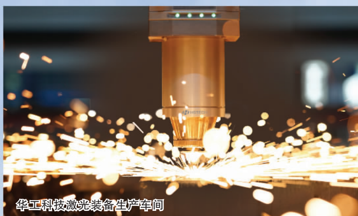
华工科技激光装备生产车间