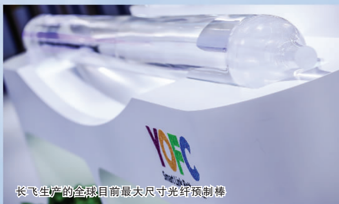
长飞生产的全球目前最大尺寸光纤预制棒