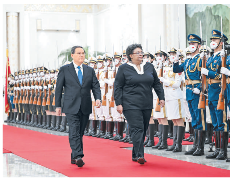
6月25日下午,国务院总理李强在北京人民大会堂同来华进行正式访问的巴巴多斯总理莫特利会谈。这是会谈前,李强在人民大会堂北大厅为莫特利举行欢迎仪式。

新形势下,中方愿同巴方进一步增进战略互信,深化各领域合作,把中巴关系打造为发展中国家团结协作、互利共赢的典范。中方愿同巴方高质量共建“一带一路”,支持巴“经济恢复和转型计划”同全球发展倡议进一步对接,增进经贸、人文等领域交流合作。中方鼓励中国企业赴巴投资兴业,愿扩大进口巴优势产品,继续为巴经济社会发展提供力所能及的帮助。欢迎巴方依托中国—加勒比发展中心落实联合国2030年可持续发展议程。 李强指出,中方理解小岛屿发展中国家在应对气候变化等方面的处境和特殊关切,愿共同寻求解决融资难题,支持广大发展中国家加快能源转型,实现可持续发展。 莫特利表示,巴方高度重视中巴关系,两国都致力于改善人民生活,促进可持续发展。巴方感谢中方为巴派遣医疗队、为巴抗击新冠疫情提供有力支持,愿同中方加强农业、能源、基础设施建设、减贫、旅游、文化、教育等领域合作,携手应对气候变化等全球性挑战。巴方反对“脱钩断链”,支持维护以世界贸易组织为核心的多边贸易体制、维护国际产业链供应链稳定。 会谈后,两国总理共同见证了落实全球发展倡议、蓝色经济、地方合作、医疗卫生、新闻媒体等多项双边合作文件的签署。