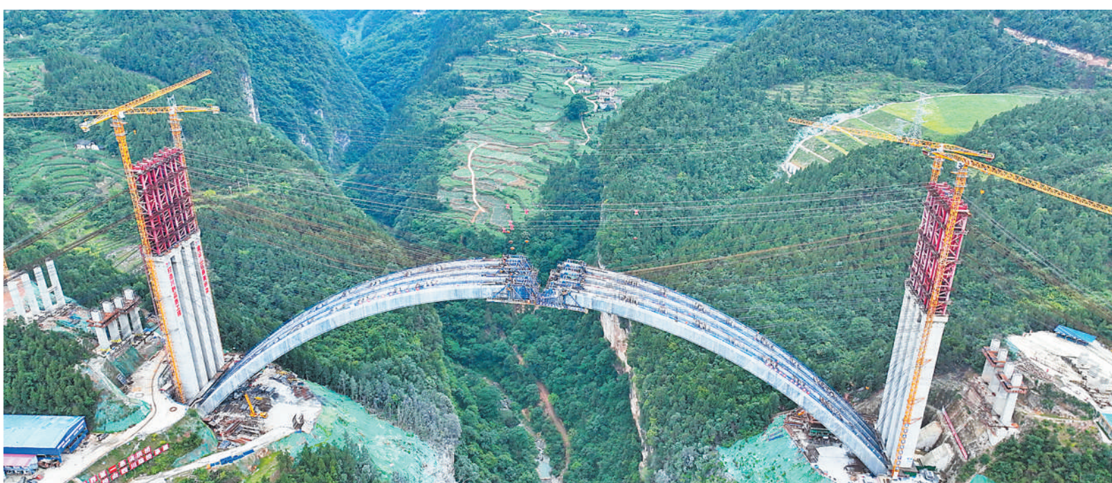
四川省持续强化交通基础设施建设,“四向八廊”综合交通体系加速形成。据了解,去年四川高速公路路网通车里程突破9000公里,今年力争突破9800公里。 位于四川省泸州市古蔺县境内的水落河特大桥是古(蔺)金(沙)高速的控制性工程,预计今年9月建成。 图为水落河特大桥建设现场。

看出,经过岁月的沉淀,这一古老节日被赋予了多重意义。祭祀祈福、团圆孝亲、强身健体等,共同构成端午文化的丰富内涵。深具文化内涵的端午传统习俗,赋予生活以仪式感,也潜移默化地将中华民族关爱生命、重视家庭、追求团结等价值观念植根人心。 传统节日是文化瑰宝,蕴藏着中华民族集体意识,描绘着中华文化的共同底色。在丰富多彩的活动过好传统佳节、品味端午文化,本身就是在塑造我们的文化认同。传统节日对于现代生活的重要意义,也正在于此。