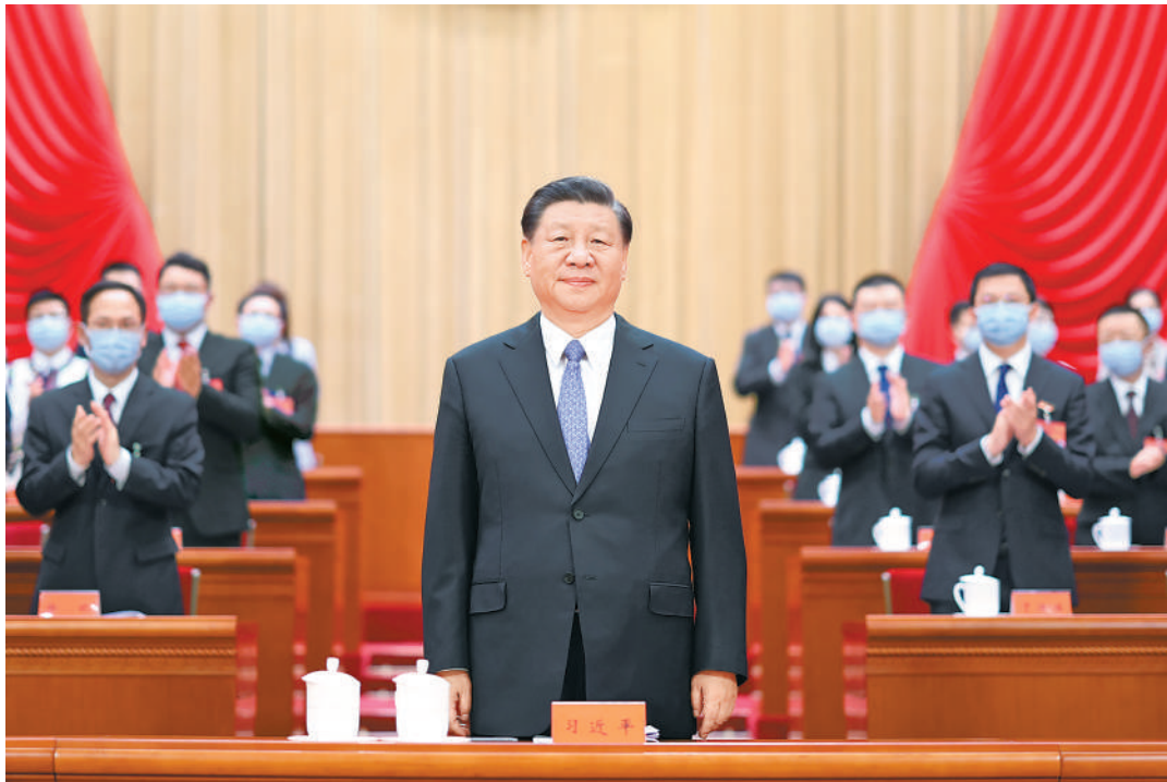
6月19日,中国共产主义青年团第十九次全国代表大会在北京人民大会堂开幕。这是中共中央总书记、国家主席、中央军委主席习近平在主席台向与会代表致意。