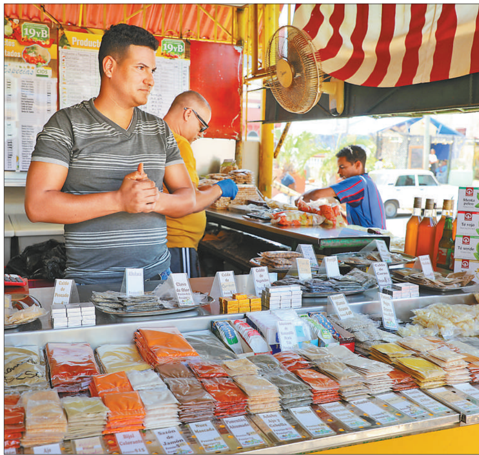
古巴首都哈瓦那一个市场内，商贩正在等待顾客前来购买调料。