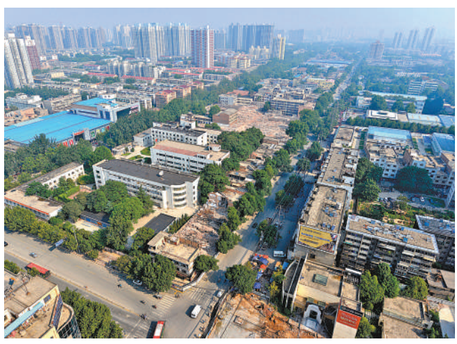
西安幸福林带建设前旧貌。

俯瞰陕西西安，有一条亮丽的景观长廊。这便是幸福林带，南北长5.85公里，东西宽210米，占地1134亩，绿化覆盖率达85%，含林带地上景观、地下空间、综合管廊、地铁配套和市政道路等5项建设内容，是集市政、生态和民生于一体的综合工程。