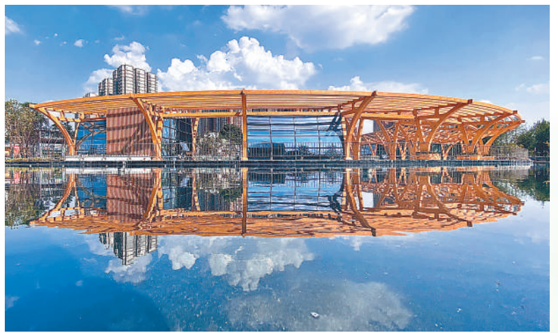
幸福林带一处水景广场。