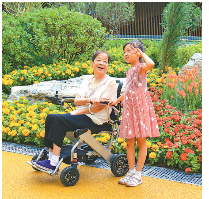
市民在幸福林带游览休闲。