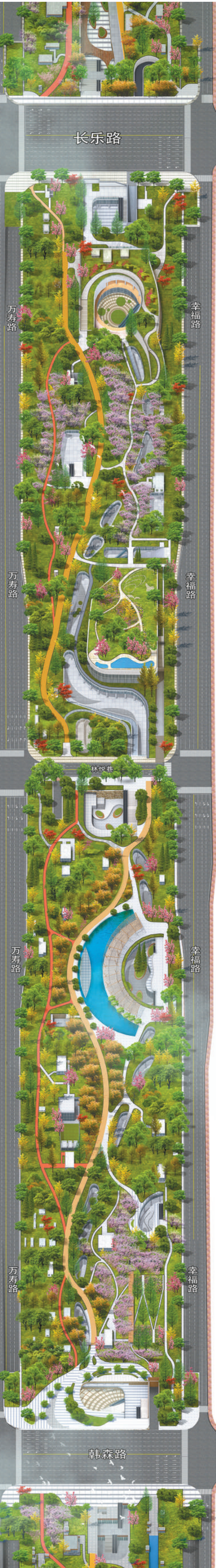
幸福林带长乐路至韩森路段建设效果图。

建设林带，不是简单造林，而是升级更新。立体绿谷，林城互融。幸福林带地上种植树木5万余棵，金黄色的步道串起23个下沉广场和34个“雨滴”天井；地下一层为商业及公共服务配套设施，将阳光、空气、绿色引入地下；地下二层有7600个停车位，两侧是综合管廊和地铁配套，综合管廊容纳电力、通信、热力、天然气、给水、再生水六大类管线。数字绿洲，智慧赋能。幸福林带运管控一体化智慧平台可实现多系统无缝打通、智能运维分析、智慧应用快速扩展等，智能调节、智慧引导，还对接西安“智慧城市大脑”，能为市民游客提供更加安全便捷的服务。（本报记者 原轲雄）