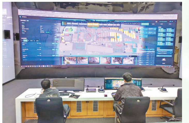
幸福林带智慧运维中心。