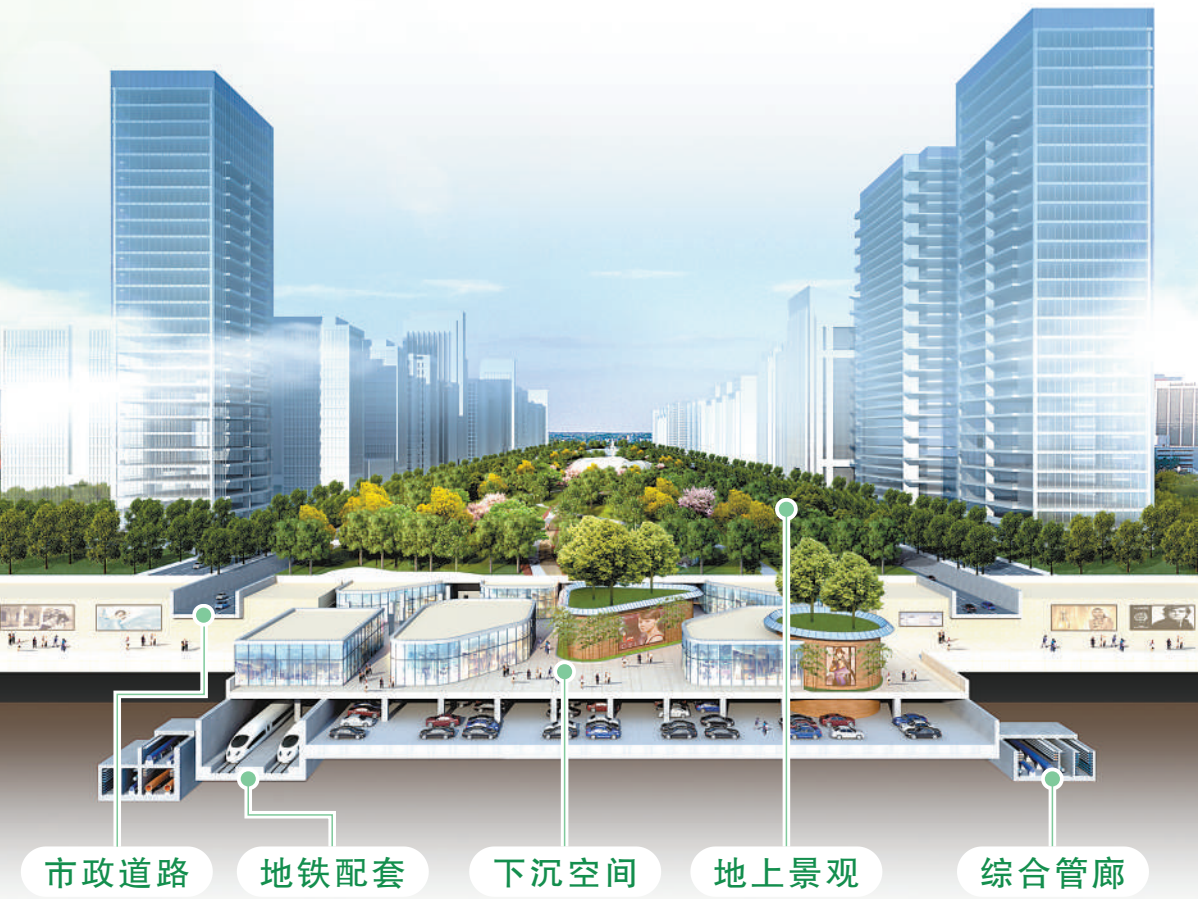
幸福林带工程剖面示意图。