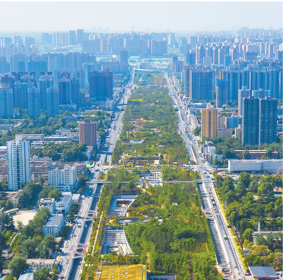
幸福林带建成后鸟瞰图。