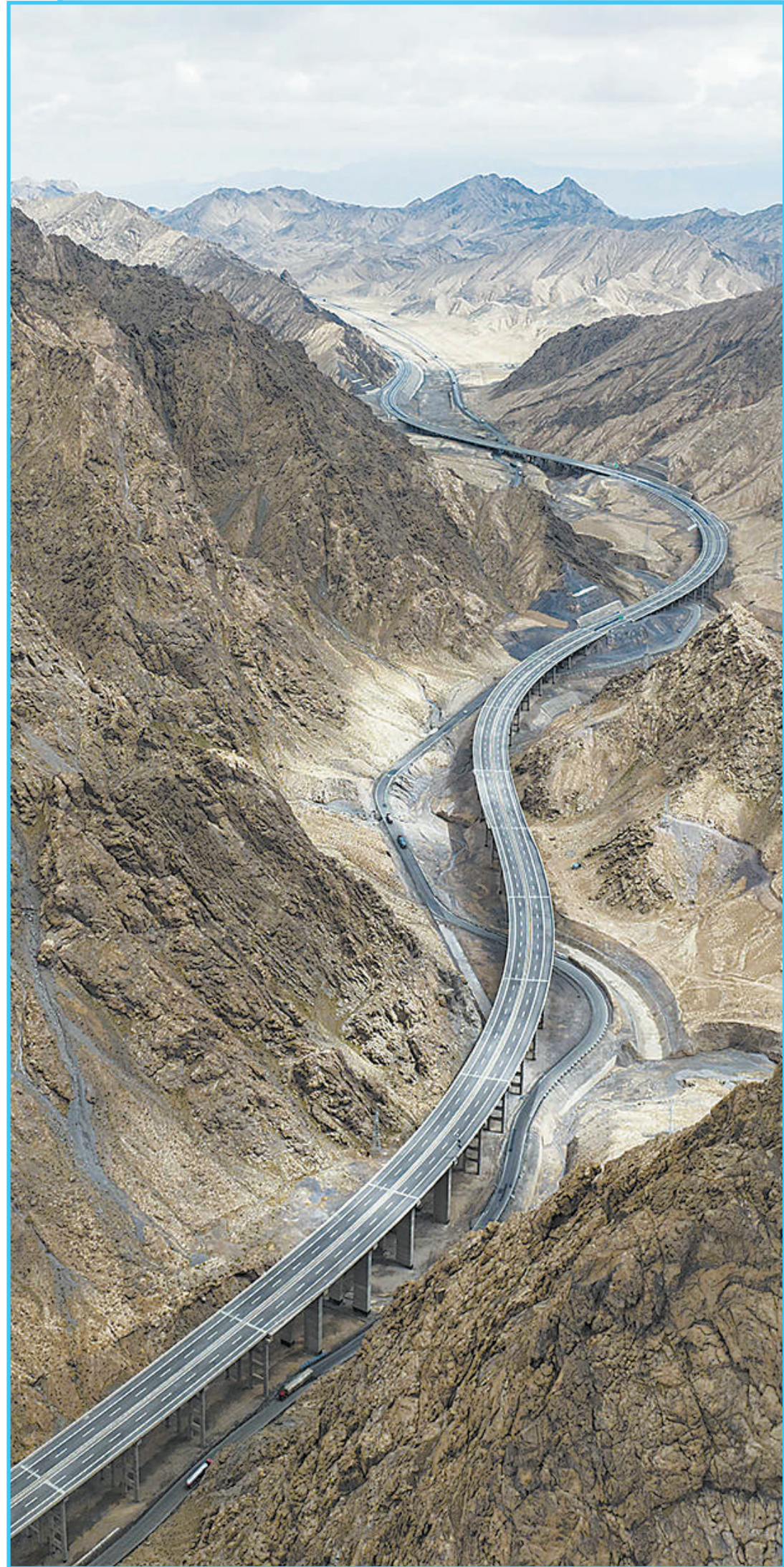
新疆依若高速建成通车,成为继G7京新高速和G30连霍高速之后进出新疆的第三条高速公路。图为依若高速公路蜿蜒穿越新疆若羌县山区。