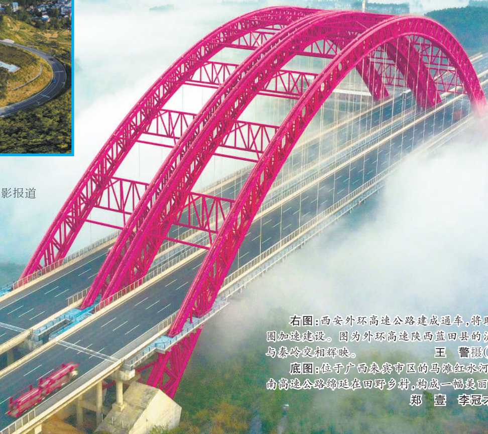
右图:西安外环高速公路建成通车,将助力西安都市圈加快建设。因为外环高速陕西蓝田县的沪河特大桥段与秦岭交相辉映。 底图:位于广西来宾市区的马滩红水河大桥,G72泉南高速公路绵延在田野乡间,构成一幅美丽画卷。