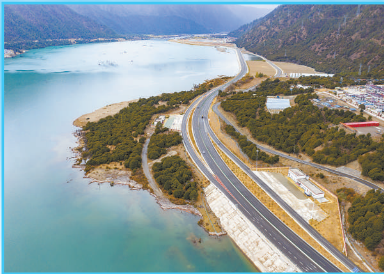
西藏拉林高等级公路平均海拔超过3000米,沿途穿越雪山、河流、森林等景观。

2021年7月,习近平总书记在西藏考察时指出:“全国的交通地图就像一幅画啊,中国的中部、东部、东北地区都是工笔画,西部留白太大了,将来也要补几笔,把美丽中国的交通勾画得更美。”