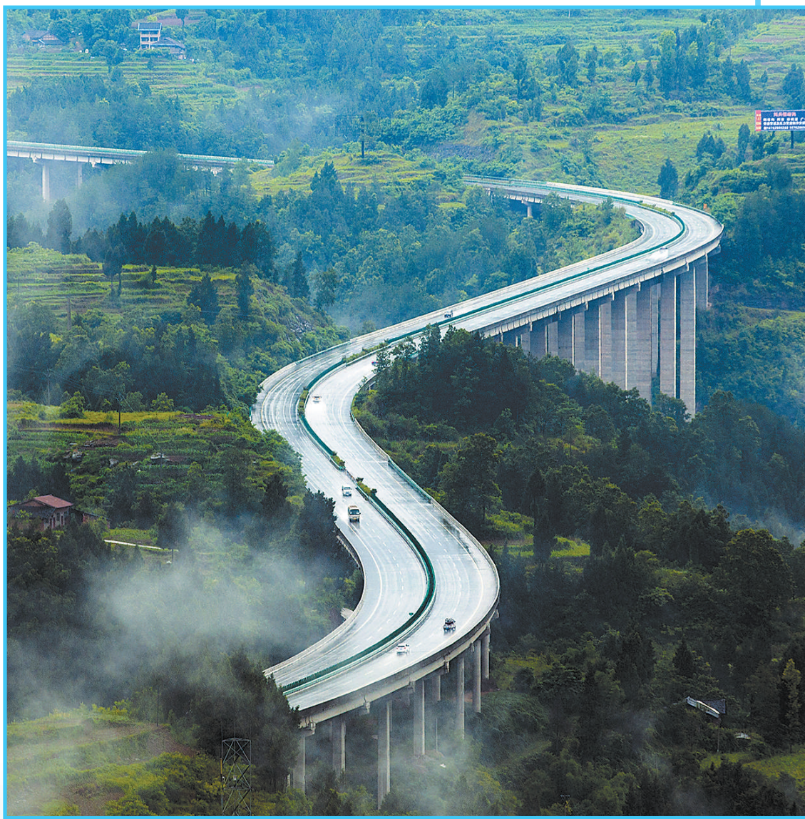
四川巴中至达州高速公路作为国家高速网的重要组成部分,是当地与华中、华东地区相互联系的便捷通道。图为巴达高速赵家湾河大桥。