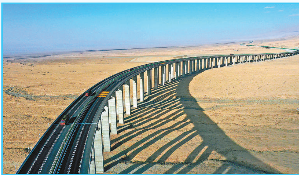
敦当高速全线通车运营。图为位于甘肃的敦当高速红崖子沟特大桥。