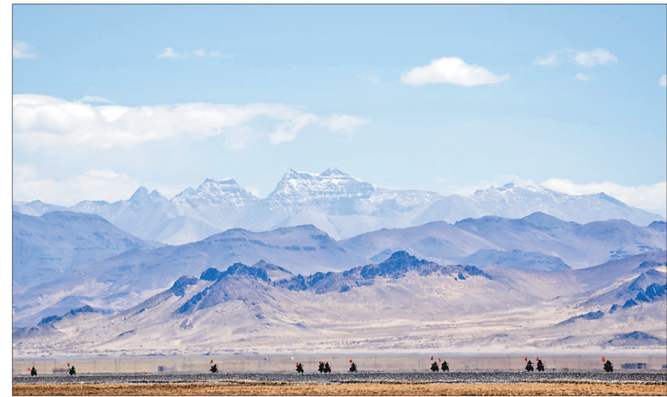
6月2日，西藏自治区日喀则市萨嘎县昌果乡的护边联防队在巡逻途中。昌果乡平均海拔超过5000米，当地牧民扎根边疆，坚持巡边护边。27年里，从1人到103人，一支由普通牧民组成的护边联防队在不断发展壮大。