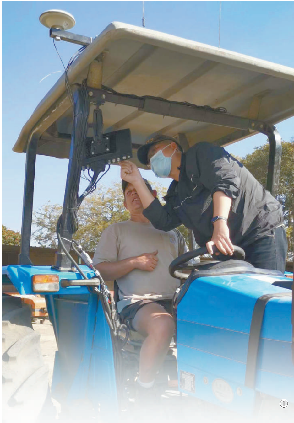
图①：中方人员指导赞比亚某农场客户调试拖拉机上装载的导航系统。

“当你走进当地一家科技公司，发现工程师是你曾经的学生，真是太有成就感了。”奥林加于2018年参加ICT学院培训并获得资格证书后，成为学院的全职教