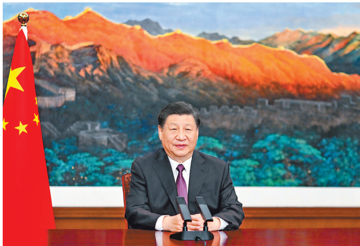
五月二十四日，国家主席习近平应邀以视频方式出席欧亚经济联盟第二届欧亚经济论坛全会开幕式并致辞。

新华社北京5月24日电 5月24日，国家主席习近平应邀以视频方式出席欧亚经济联盟第二届欧亚经济论坛全会开幕式并致辞。 习近平指出，当今世界正处于百年未有之大变局，世界多极化、经济全球化历史潮流势不可当。坚持真正的多边主义，推动区域协调发展，是国际社会广泛共识。亚欧大陆是世界人口最多、国家最多、文明最具多样性的地区。面对动荡变革的世界，亚欧合作之路应该怎么走？这不仅关乎地区人民福祉，也深刻影响世界发展走向。 习近平强调，对于这样的时代之问、历史之问，中国的答案是明确的。我先后提出全球发展倡议、全球安全倡议、全球文明倡议，呼吁各国共同致力于建设持久和平、普遍安全、共同繁荣、开放包容、清洁美丽的世界，推动构建人类命运共同体。今年是我提出共建“一带一路”倡议十周年。这个倡议的根本出发点和落脚点，就是探索远亲近邻共同发展的新办法，开拓造福各国、惠及世界的“幸福路”。 习近平强调，作为亚欧大家庭的一员，中国的发展离不开亚欧地区，也惠及亚欧地区。中方真诚希望，共建“一带一路”同欧亚经济联盟建设对接合作走深走实，各国团结协作、勠力同心，携手开创亚欧合作新局面。今年下半年，中方将举办第三届“一带一路”国际合作高峰论坛。中方愿同“一带一路”共建国和欧亚经济联盟成员国一道，继续高举和平、发展、合作、共赢旗帜，共享机遇，共克时艰，共创未来，携手谱写多极化世界文明进步新篇章。 欧亚经济联盟第二届欧亚经济论坛于5月24日在俄罗斯莫斯科以线上线下相结合方式举行，主题为“多极化世界中的欧亚一体化”。