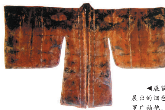
▲展览展出的烟色罗广袖袍。

“碧海帆影”作为开篇,介绍了航海历史。较之陆上丝绸之路考古与研究的长久热潮,海上丝绸之路的相关研究起步较晚。《汉书·地理志》记载,汉代官商携带黄金和各色丝绸从徐闻、合浦出发,与东南亚及南亚的古国进行珍珠、璧琉璃、奇石异物贸易。学界普遍认为,这是海上丝绸之路形成的标志之一。合浦汉墓出土的来自西亚地区的文物、鉴真第六次东渡日本的起航地张家港黄泗浦遗址、南宋南海一号沉船等考古发现,则为海上丝绸之路提供了新材料。展览选取了汉武帝从合浦和徐闻发遣通使、宋代“神舟”出使高丽、明初郑和下西洋三件历史大事进行描述,并展出相关文物。如湖北博物馆所藏的永乐时期金锭,刻有“西洋等处买到八成色金壹锭”铭文,出土于梁庄王墓,是郑和下西洋这一历史事件的实物证据。