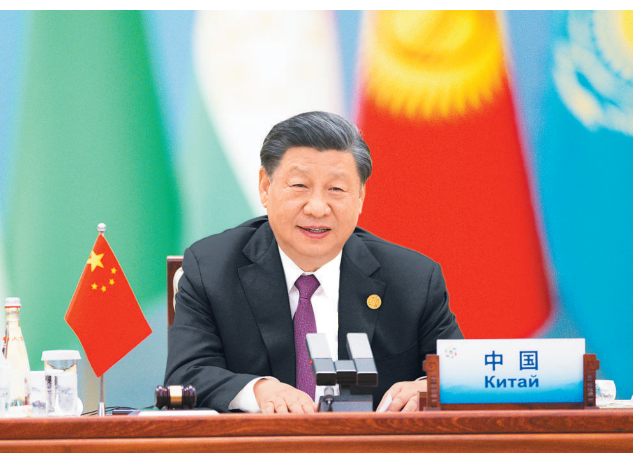
5月19日上午,国家主席习近平在陕西省西安市主持首届中国—中亚峰会并发表题为《携手建设守望相助、共同发展、普遍安全、世代友好的中国—中亚命运共同体》的主旨讲话。