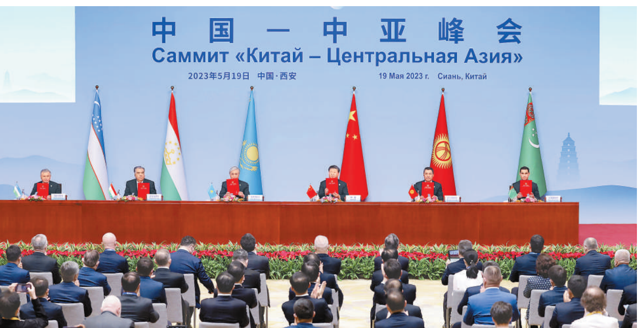
5月19日上午,国家主席习近平在陕西省西安市主持首届中国—中亚峰会并发表题为《携手建设守望相助、共同发展、普遍安全、世代友好的中国—中亚命运共同体》的主旨讲话。哈萨克斯坦总统托卡耶夫、吉尔吉斯斯坦总统扎帕罗夫、塔吉克斯坦总统拉赫蒙、土库曼斯坦总统别尔德穆哈梅多夫、乌兹别克斯坦总统米尔济约耶夫出席。习近平同中亚五国元首签署了《中国—中亚峰会西安宣言》,并通过《中国—中亚峰会成果清单》。

本报西安5月19日电 (记者王乐文、张丹华)5月19日上午,国家主席习近平在陕西省西安市主持首届中国—中亚峰会。哈萨克斯坦总统托卡耶夫、吉尔吉斯斯坦总统扎帕罗夫、塔吉克斯坦总统拉赫蒙、土库曼斯坦总统别尔德穆哈梅多夫、乌兹别克斯坦总统米尔济约耶夫出席。元首们在友好的气氛中全面回顾中国同中亚五国友好交往历史,总结各领域合作经验,展望未来合作方向,一致同意着眼未来,携手构建更加紧密的中国—中亚命运共同体。 5月的西安,花团锦簇,生机盎然。灞河之滨的西安国际会议中心,中国和中亚五国国旗迎风飘扬,与中国—中亚峰会会标交相辉映,千年古都迎来一场历史与未来交融的盛会。 中亚五国元首相继抵达。习近平同五国元首亲切握手并集体合影。 10时许,中国—中亚峰会正式开始。 习近平首先代表中国政府和中国人民对五国元首来到西安出席首届中国—中亚峰会表示热烈欢迎。习近平指出,当今世界,百年未有之大变局加速演进,国际和地区形势正在发生深刻复杂变化,机遇和挑战都前所未有。在这个关键历史时刻,我们召开中国—中亚峰会,顺应合作共赢的时代潮流,体现世代友好的人民期盼,必将对中国同中亚国家关系发展产生重要而深远的影响,并具有世界意义。中方愿同各方一道,以西安峰会为契机,总结历史经验,擘画合作蓝图,展现凝聚力、创造力、行动力,共同推动中国—中亚关系行稳致远。 习近平发表题为《携手建设守望相助、共同发展、普遍安全、世代友好的中国—中亚命运共同体》的主旨讲话。(全文见第二版) 习近平指出,西安是中华文明和中华民族的重要发祥地之一,也是古丝绸之路的东方起点。千百年来,中国同中亚各族人民一道推动了丝绸之路的兴起和繁荣,为世界文明交流交融、丰富发展作出了历史性贡献。今天我们在西安相聚,续写千年友谊,开辟崭新未来,具有十分重要的意义。 习近平指出,2013年,我提出共建“丝绸之路经济带”倡议。10年来,中国同中亚国家携手推动丝绸之路全面复兴,倾力打造面向未来的深度合作,将双方关系带入一个崭新时代。中国同中亚国家关系有着深厚的历史渊源、广泛的现实需求、坚实的民意基础,在新时代焕发出勃勃生机和旺盛活力。 当前,世界之变、时代之变、历史之变正以前所未有的方式展开。中亚处在联通东西、贯穿南北的十字路口。 世界需要一个稳定的中亚。中亚国家主权、安全、独立、领土完整必须得到维护,中亚人民自主选择的发展道路必须得到尊重,中亚地区致力于和平、和睦、安宁的努力必须得到支持。 世界需要一个繁荣的中亚。一个充满活力、蒸蒸日上的中亚,将实现地区各国人民对美好生活的向往,也将为世界经济复苏发展注入强劲动力。 世界需要一个和谐的中亚。团结、包容、和睦是中亚人民的追求。任何人都无权在中亚制造不和、对立,更不应该从中谋取政治私利。 世界需要一个联通的中亚。中亚有基础、有条件、有能力成为亚欧大陆重要的互联互通枢纽,为世界商品交换、文明交流、科技发展作出中亚贡献。 习近平指出,去年,中国和中亚五国宣布建设中国—中亚命运共同体,这是我们在新的时代背景下,着眼各国人民根本利益和光明未来,作出的历史性选择。建设中国—中亚命运共同体,要做到四个坚持: (下转第二版)