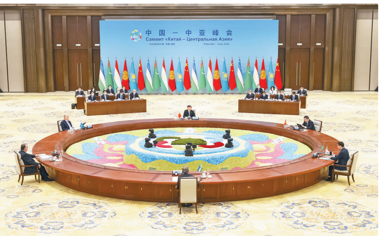
5月19日上午,国家主席习近平在陕西省西安市主持首届中国—中亚峰会并发表题为《携手建设守望相助、共同发展、普遍安全、世代友好的中国—中亚命运共同体》的主旨讲话。哈萨克斯坦总统托卡耶夫、吉尔吉斯斯坦总统扎帕罗夫、塔吉克斯坦总统拉赫蒙、土库曼斯坦总统别尔德穆哈梅多夫、乌兹别克斯坦总统米尔济约耶夫出席。