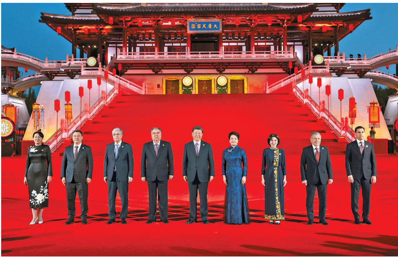
5月18日晚,国家主席习近平和夫人彭丽媛在陕西省西安市大唐芙蓉园为出席中国—中亚峰会的中亚国家元首夫妇举行欢迎仪式和欢迎宴会。宴会后,习近平夫妇同贵宾们共同观看中国同中亚国家人民文化艺术年暨中国—中亚青年艺术节开幕式演出。这是习近平发表欢迎致辞,代表中国政府和中国人民热烈欢迎中亚各国元首。