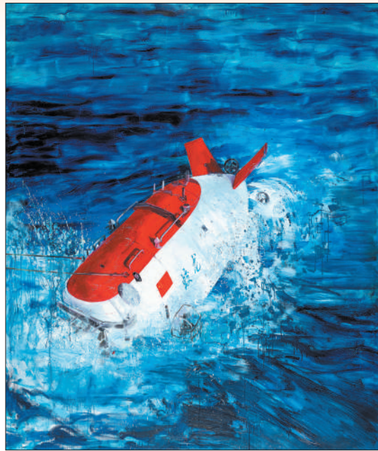
▲蛟龙入海(油画) 张辉君

从展览中，可以感受到各地画院美术工作者坚持守正创新、孜孜求索的艺术精神。他们的创作，接