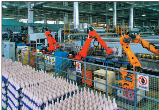
左图:四川泸州市合江临港工业园区一家公司成瓷车间,一个个酒瓶经过“数智化”生产,定型出炉。

工业互联网是制造业数字化转型的关键支撑,加快工业互联网应用推广对于实现经济高质量发展具有重要意义。据工信部数据,目前,工业互联网已覆盖45个国民经济大类、166个中类,覆盖工业大类的85%以上,工业互联网核心产业规模超过1.2万亿元。