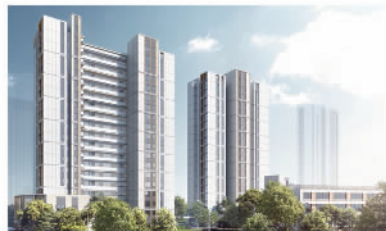
福州和寓公馆项目

保利发展控股以不动产投资开发为原点，立体延展“不动产生态”，通过人才、资本、科技、信息的链接，致力于成为全球最具活力的不动产生态平台。