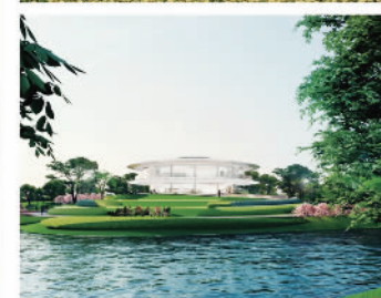
上海闵行区元江路TOD项目