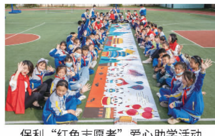
保利“红色志愿者”爱心助学活动