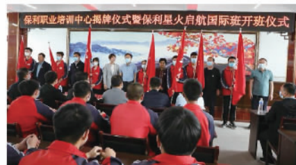
保利发展控股推动“保利星火启航”项目，在山西省五台县成立保利职业培训中心

保利发展控股多措并举投身乡村振兴，持续加大援助力度，积极参与乡村治理，因地制宜、因情施策，通过产业帮扶、消费帮扶、项目帮扶、就业帮扶、资金帮扶、社会治理等手段，助力乡村实现高质量发展。