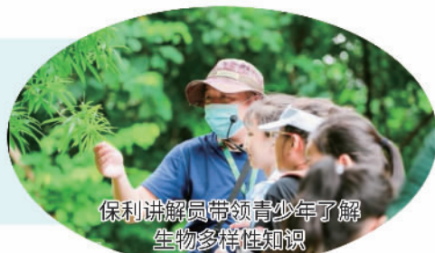
保利讲解员带领青少年了解生物多样性知识

● 加强环境治理。不断完善环境管理机制，积极应对气候变化，维护生物多样性，持续走实绿色和谐发展之路。