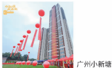
广州小新塘改造项目

截至2022年末，保利发展控股共参与及跟进超过130个城市更新项目，涉及25个城市。