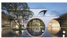
浙江宁波保利和颂望悦