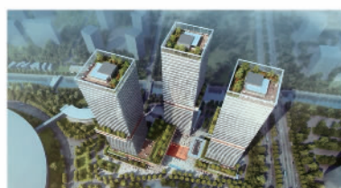
上海保利浦开金融中心成为上海绿色建筑新地标

● 打造绿色工程。2022年，建筑面积100%达到绿色建筑设计标准。其中，完成认证的国家绿色建筑项目16个，认证面积265.2万平方米。