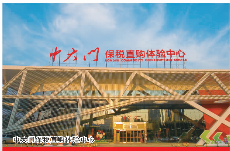
中大门保税直购体验中心