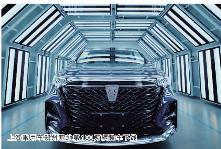
上汽乘用车郑州基地第100万辆整车下线

管服务模式,为跨境电商商品的便捷准入和快速流通创造条件,成为海关总署监管代码和全球跨境电商通关服务解决方案之一,世界海关组织将“1210”模式作为全球推广示范的样板。