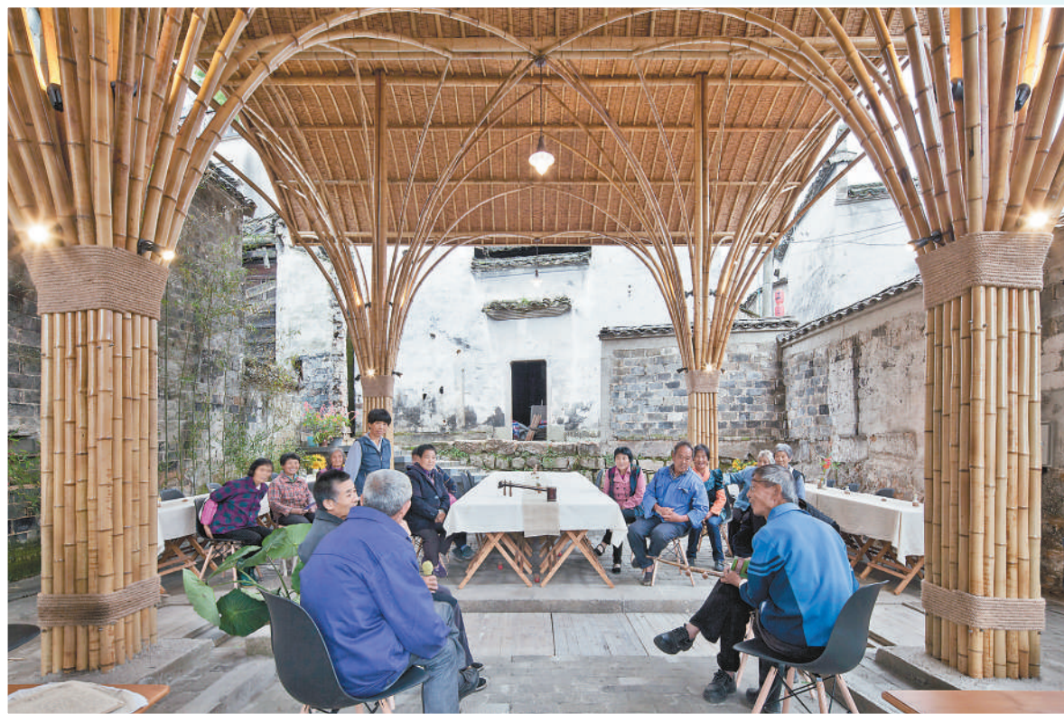
▲安徽省宣城市绩溪县高村的“竹篷乡堂”。