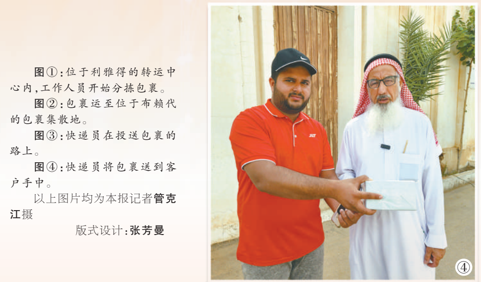
图①:位于利雅得的转运中心内,工作人员开始分拣包裹。 图②:包裹运至位于布赖代的包裹集散地。 图③:快递员在投递包裹的路上。 图④:快递员将包裹送到客户手中。