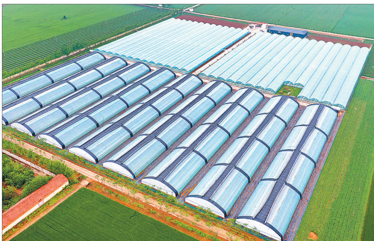
近年来,河南省尉氏县大力发展现代设施农业,帮助群众家门口就业,促进农业增效农民增收。图为尉氏县一处特色农业种植园的温室大棚。