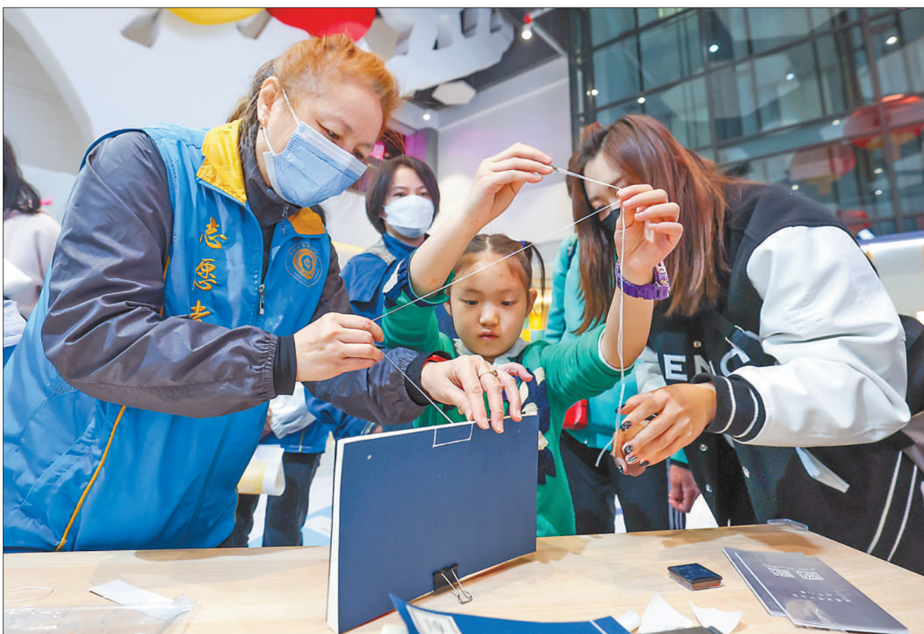
4月22日,中国宋庆龄青少年科技文化交流中心与中国互联网发展基金会共同发起“数字阅读,与你一同成长”全民阅读公益项目,并举办“阅读经典 悦享童年”展示体验活动。图为小朋友在交流中心活动现场体验线装书制作。

与会嘉宾表示,阅读是给青少年最好的礼物。要针对青少年身心特点和成长规律,创新方式方法,从思想深处打动和赢得青少年。要加强场所建设,让青少年方便快捷地利用优秀图书资源。要注重培养互联网时代的新读写能力,实现智慧阅读、高效阅读。要倡导出版经典、推广经典、阅读经典,将更多优质图书送达青少年读者,用阅读照亮更多孩子的成长之路。