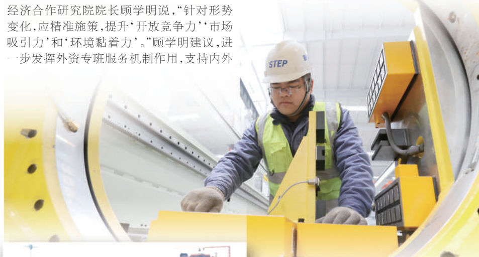
图①：浙江德清县雷甸镇一家高空作业机械生产企业的工人在调试智能化生产线。

对此，刘劲松建议以展会为纽带赋能外贸高质量发展，提升国内展会办展质量，同时推动出国展览体制创新，及时帮助参展企业纾困解难，助力企业“走出去”更顺更稳。