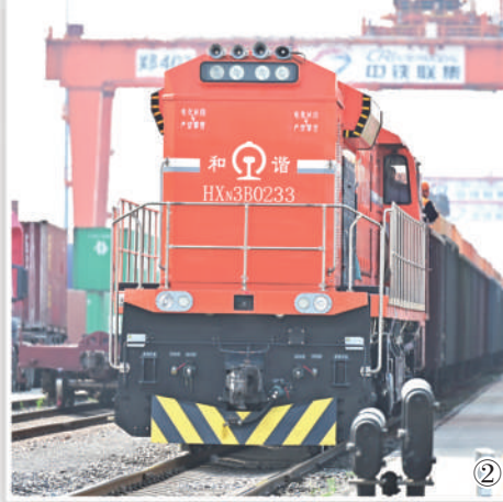
图②：河南郑州市，一列中欧班列等待发车。