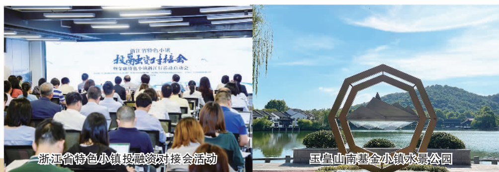
浙江省特色小镇投融资对接会活动