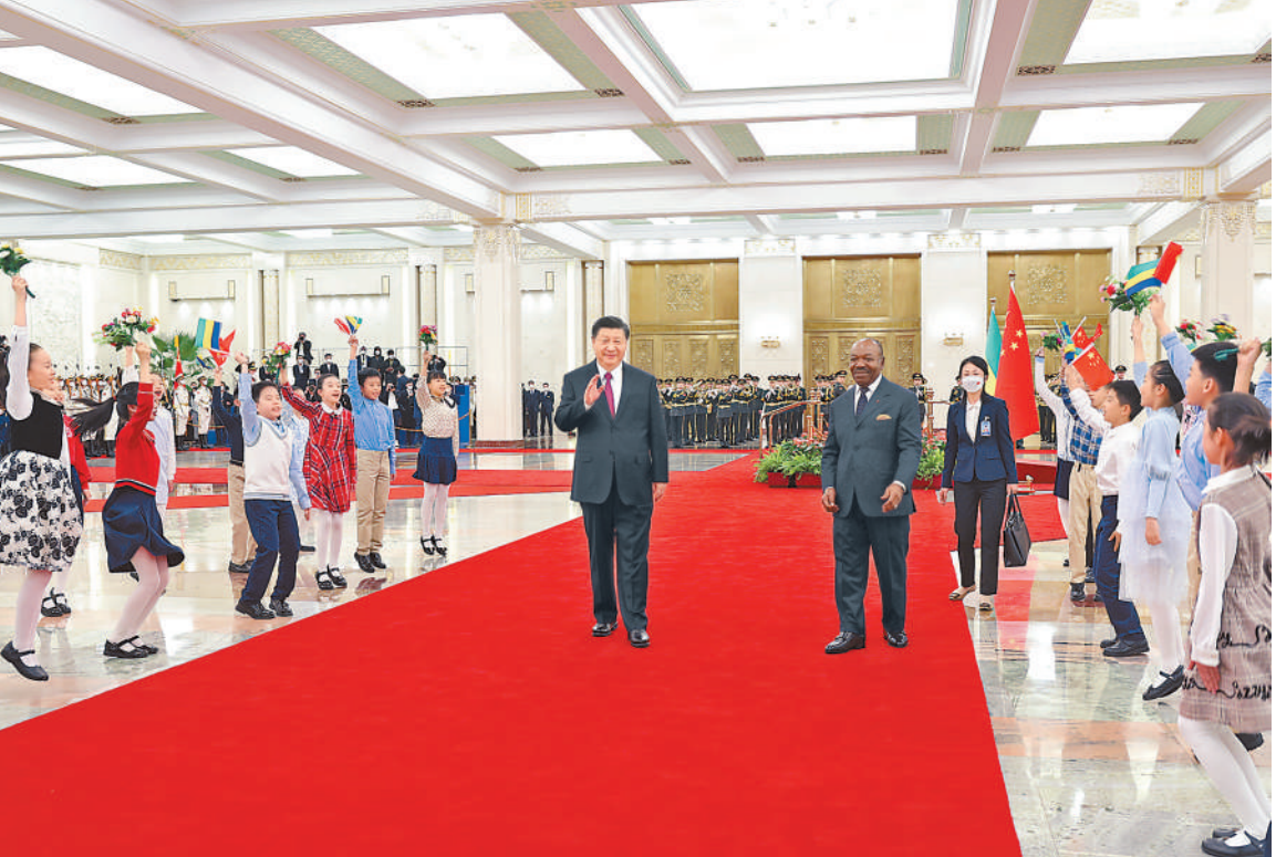
四月十九日下午，国家主席习近平在北京人民大会堂同来华进行国事访问的加蓬总统邦戈举行会谈。这是会谈前，习近平在人民大会堂会见加蓬总统邦戈一行。