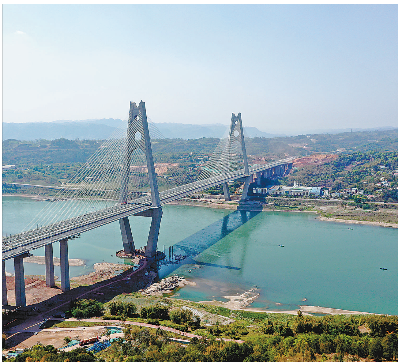
日前，成自宜高铁重点控制性工程宜宾临港公铁两用长江大桥附属工程进入收尾阶段。成自宜高铁是四川省境内一条连接成都市、自贡市与宜宾市的高速铁路，全线约260公里。项目建成投用后，从成都到自贡仅需40分钟，到宜宾仅需1小时左右。