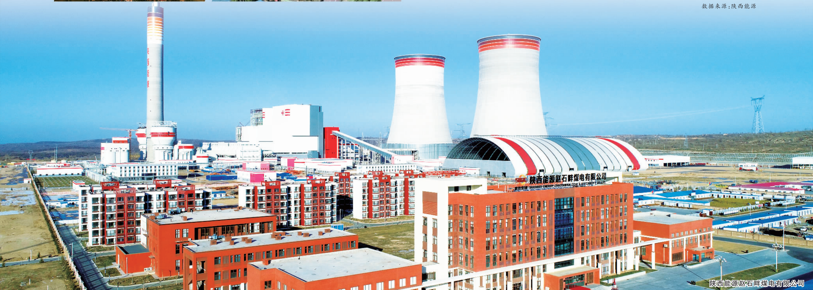
陕西能源赵石畔煤电有限公司