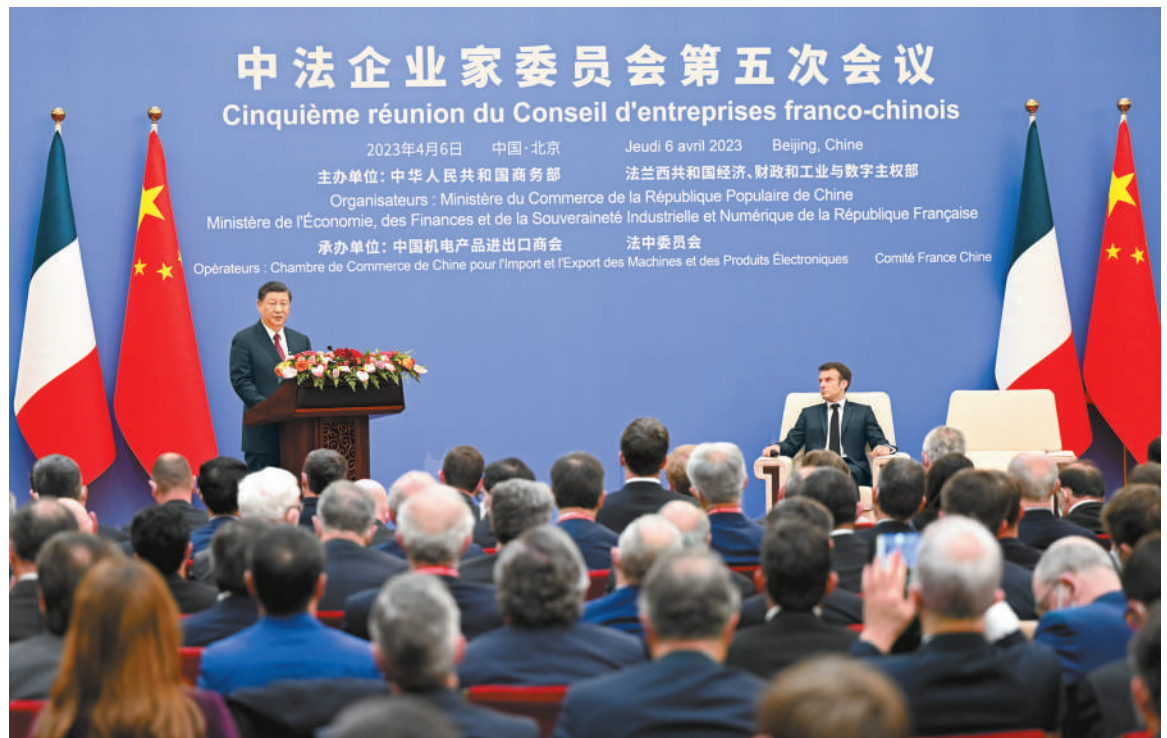
四月六日下午，国家主席习近平在北京同法国总统马克龙共同出席中法企业家委员会第五次会议闭幕式并致辞。

新华社北京4月6日电（记者刘华）4月6日下午，国家主席习近平在北京同法国总统马克龙共同出席中法企业家委员会第五次会议闭幕式并致辞。习近平指出，世界正发生深刻复杂变化。面对困难和挑战，中法两国坚持真正的多边主义，坚持自由贸易和经济全球化正确方向，极大增强了双边经贸合作的韧性和活力。双边贸易额和相互直接投资稳步增长，大项目合作深入推进，绿色消费、绿色能源、科技创新等新兴领域合作不断拓展。中法经贸合作不仅助推两国经济发展、增进民生福祉，而且为世界经济复苏增强了信心、稳定了预期。当前，中国经济社会活力充分释放，中法、中欧各领域对话合作全面激活，我们应该抓住机遇，加强合作，共创美好未来。我们要坚持开放包容，深化双边互利合作。中国将加快开拓国内市场。