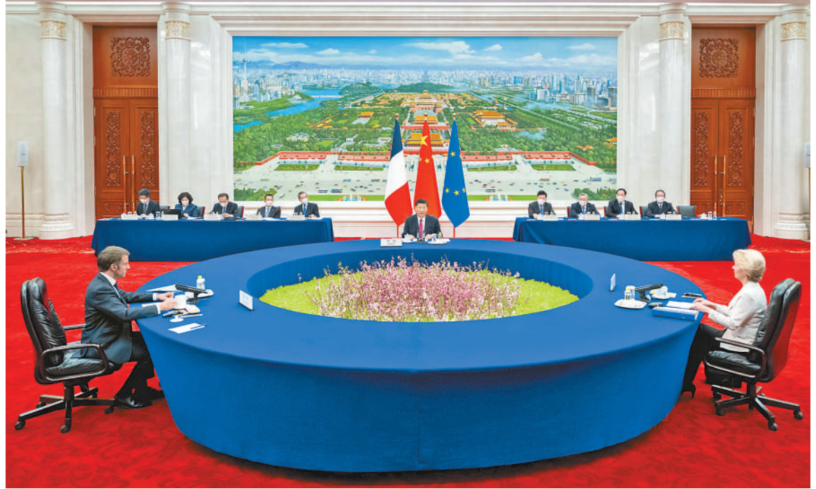
四月六日下午，国家主席习近平在北京人民大会堂同法国总统马克龙、欧盟委员会主席冯德莱恩举行中法欧三方会晤。

新华社北京4月6日电（记者刘华）4月6日下午，国家主席习近平在人民大会堂同法国总统马克龙、欧盟委员会主席冯德莱恩举行中法欧三方会晤。习近平指出，中欧双方有着广泛共同利益，合作大于竞争，共识多于分歧。当前，国际形势复杂多变，中欧双方应该坚持相互尊重，增进政治互信，加强对话合作，共同维护世界和平稳定，促进共同发展繁荣，携手应对全球性挑战。今年是欧盟建立全面战略伙伴关系20周年。中方愿同欧方一道，把握好中欧关系发展大方向和主基调，全面重启各层级交往，激活各领域互利合作，为中欧关系发展和世界和平、稳定、繁荣注入新动力。习近平强调，要增强中欧关系的稳定性。