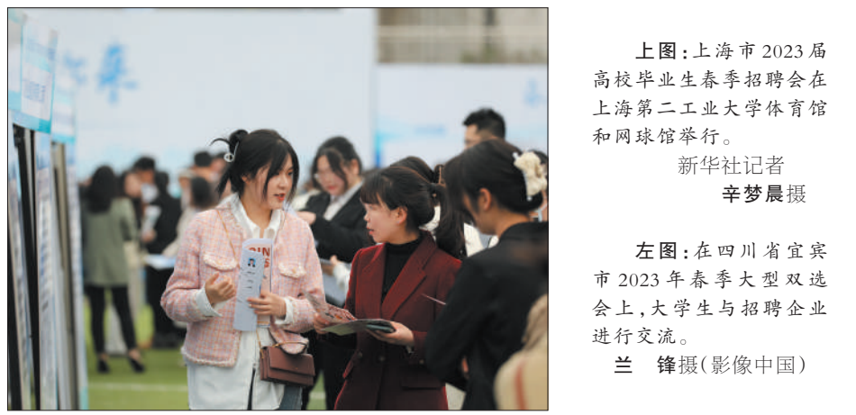
上图：上海市2023届高校毕业生春季招聘会在上海第二工业大学体育馆和网球场举行。左图：在四川省宜宾市2023年春季大型双选会上，大学生与招聘企业进行交流。

党的二十大报告提出“坚持和完善社会主义基本经济制度”，要求“优化民营企业发展环境，依法保护民营企业产权和企业权益，促进民营经济发展壮大”。民营经济是社会主义市场经济发展的重要成果，是推动社会主义市场经济发展的重要力量，是推进供给侧结构性改革、推动高质量发展、建设现代化经济体系的重要主体，也是我们党长期执政、团结带领全国人民实现“两个一百年”奋斗目标和中华民族伟大复兴中国梦的重要力量。在强国建设、