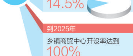
数据来源：河北省商务厅、正定县

们采购住往得提前列单子，生怕有遗漏，没私车的时候，还要几家拼车或者坐公交车往返，特别不方便。