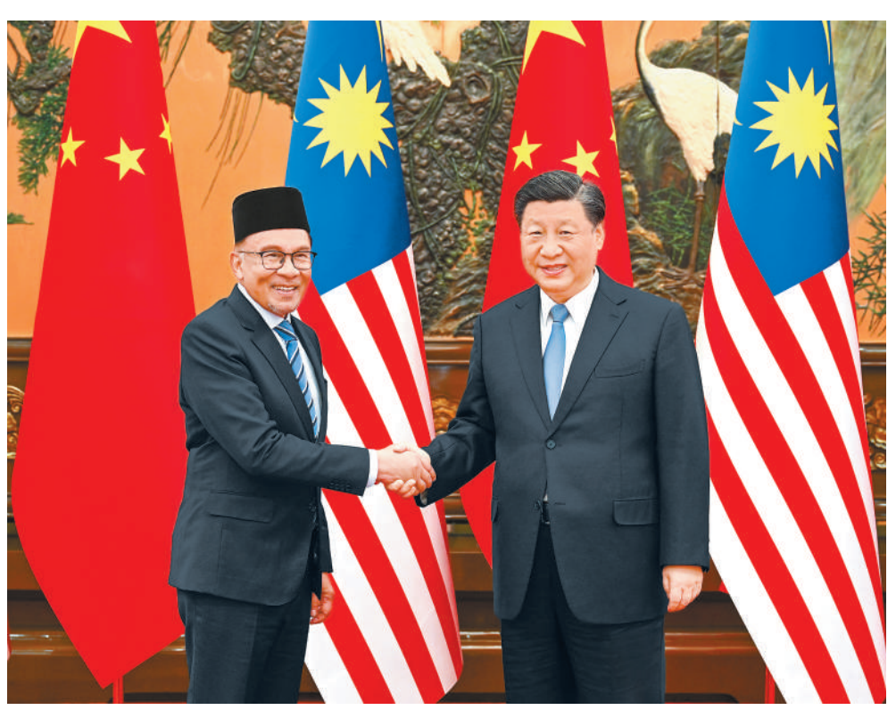
3月31日下午,国家主席习近平在北京人民大会堂会见来华进行正式访问的马来西亚总理安瓦尔。