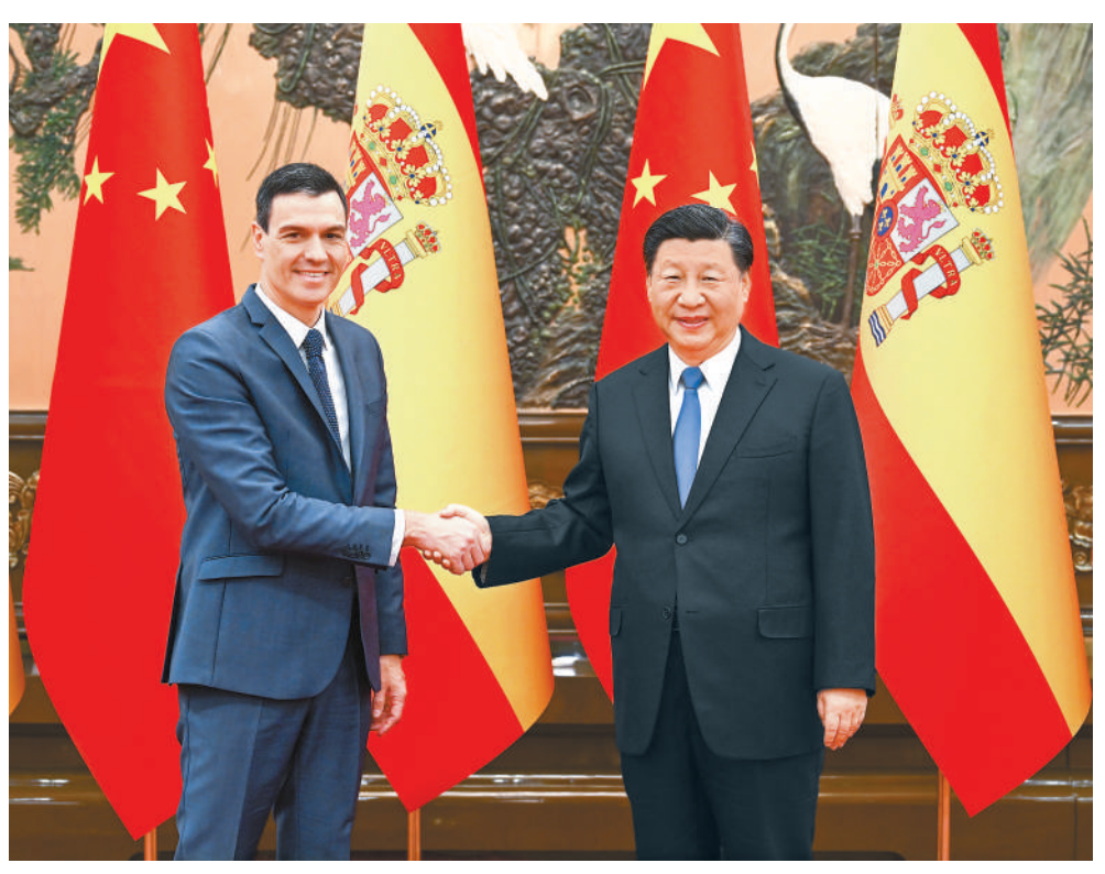
3月31日下午,国家主席习近平在北京人民大会堂会见来华进行正式访问的西班牙首相桑切斯。

新华社北京3月31日电 (记者郑明达)3月31日下午,国家主席习近平在人民大会堂会见来华进行正式访问的西班牙首相桑切斯。习近平请桑切斯转达对费利佩六世国王的诚挚问候。