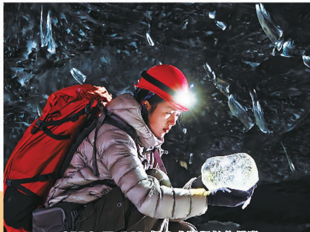
OPPO Find X6超光感潜望长焦样张