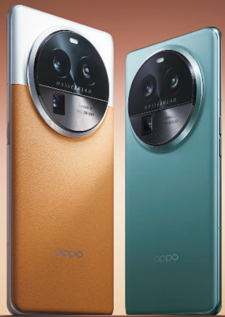
OPPO于3月21日发布的全新影像旗舰Find X6系列