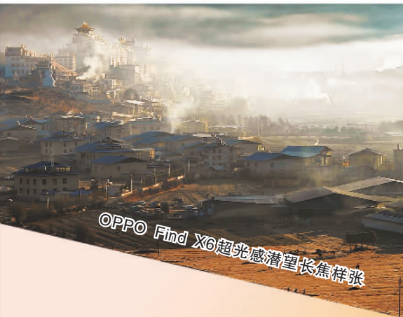
OPPO Find X6超光感潜望长焦样张