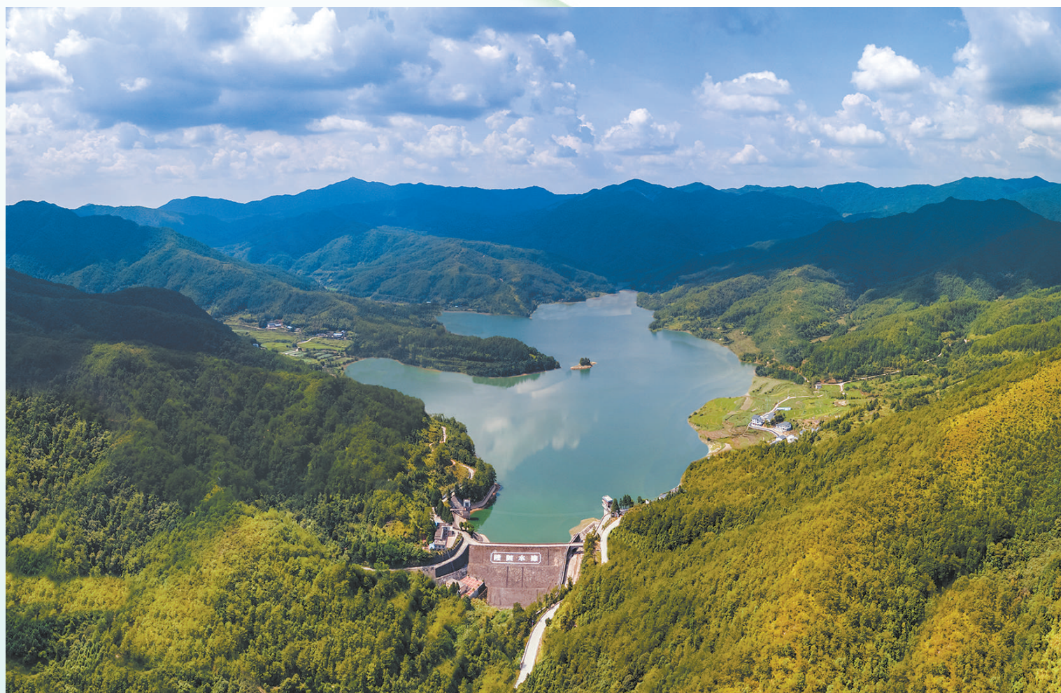
图①:安徽省无为市无城镇环城河,河畅水清、岸绿景美。 图②:广西壮族自治区柳州市融安县东起乡崖脚村铜板屯,自2020年饮水工程建成后,家家用上自来水(摄于2022年9月)。 图③:广西壮族自治区柳州市融安县东起乡崖脚村铜板屯,村民在修建饮水工程(摄于2017年8月)。 图④:江苏省如皋市龙游河畔,色彩斑斓的树木与清清河水、彩色健身步道构成一幅人与自然和谐共生的美景。 图⑤:宁夏回族自治区银川市海宝公园,市民在观赏候鸟。 图⑥:福建省宁化县石壁镇隆陂村的隆陂水库,是当地重要水源地之一。 图⑦:山西省运城市盐湖景区吸引了不少鸟儿在此栖息。