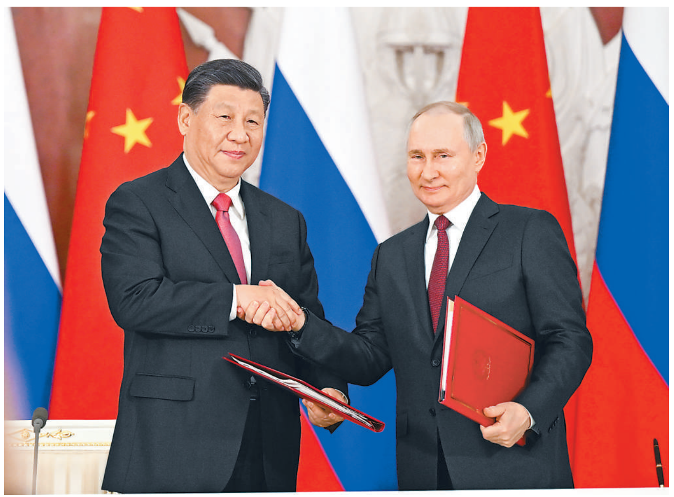
当地时间3月21日下午,国家主席习近平在莫斯科克里姆林宫同俄罗斯总统普京举行会谈。这是会谈后,两国元首共同签署《中华人民共和国和俄罗斯联邦关于深化新时代全面战略协作伙伴关系的联合声明》和《中华人民共和国主席和俄罗斯联邦总统关于2030年前中俄经济合作重点方向发展规划的联合声明》。