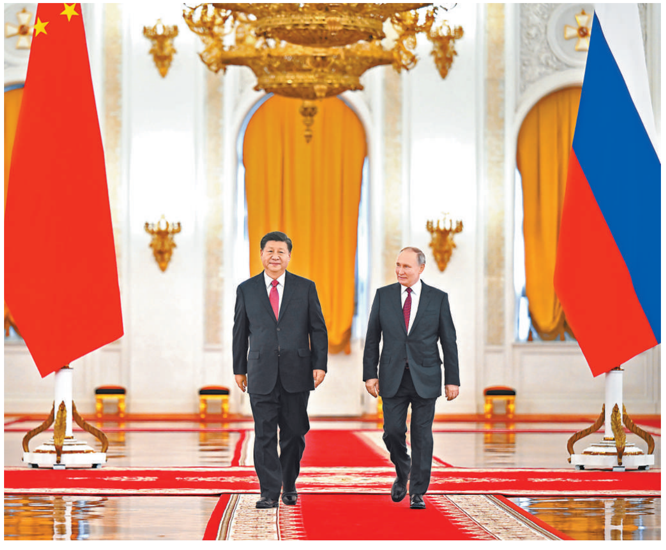
当地时间3月21日下午,国家主席习近平在莫斯科克里姆林宫同俄罗斯总统普京举行会谈。这是普京在乔治大厅为习近平举行隆重欢迎仪式。

当晚,普京在克里姆林宫为习近平举行了隆重欢迎宴会。蔡奇、王毅、秦刚,以及俄罗斯联邦政府领导人出席上述活动。