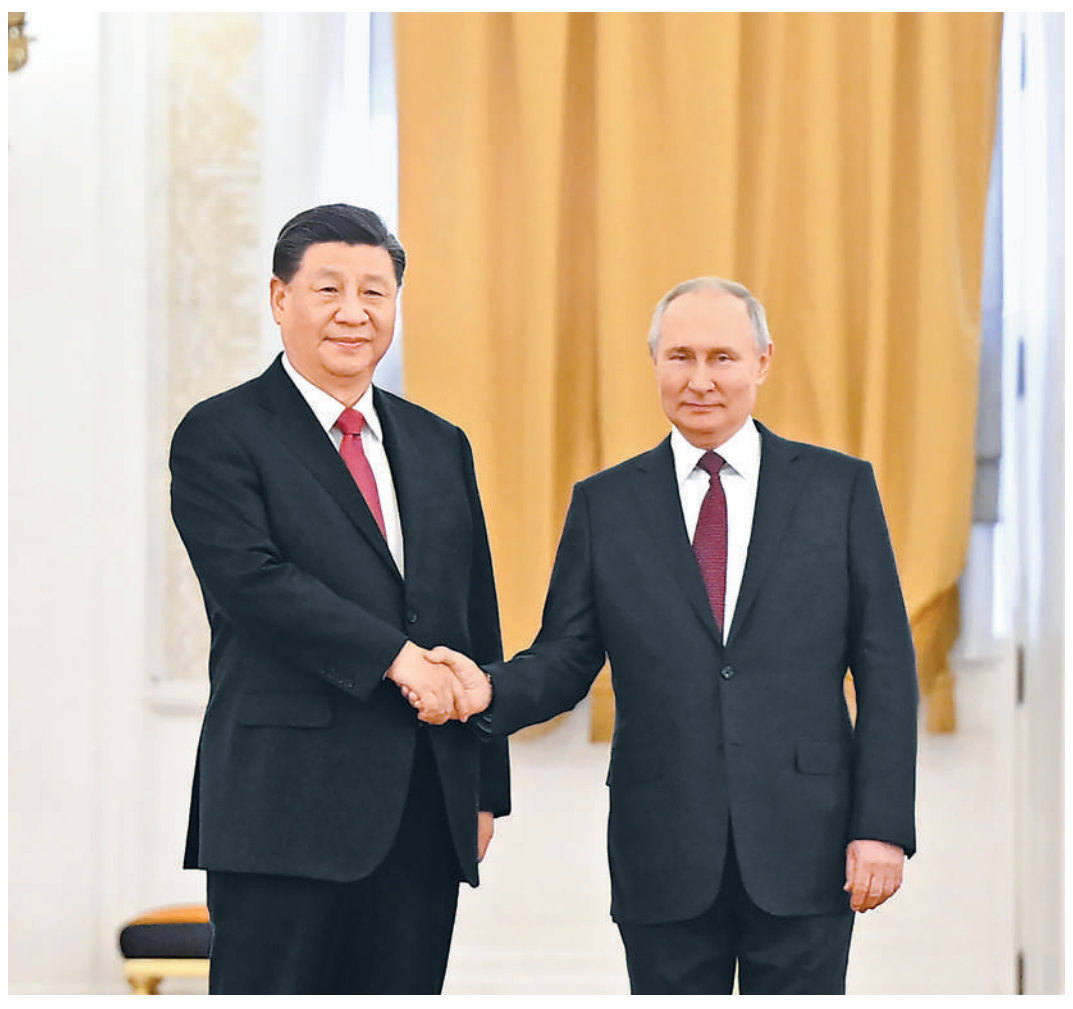
当地时间3月21日下午,国家主席习近平在莫斯科克里姆林宫同俄罗斯总统普京举行会谈。普京在乔治大厅为习近平举行隆重欢迎仪式。这是两国元首紧紧握手,合影留念。

本报莫斯科3月21日电 (记者杜尚泽、曲颂)当地时间3月21日下午,国家主席习近平在莫斯科克里姆林宫同俄罗斯总统普京举行会谈。两国元首就中俄关系及共同关心的重大国际和地区问题进行了真挚友好、富有成果的会谈,达成许多新的重要共识。双方一致同意,本着睦邻友好、合作共赢原则推进各领域交往合作,深化新时代全面战略协作伙伴关系。