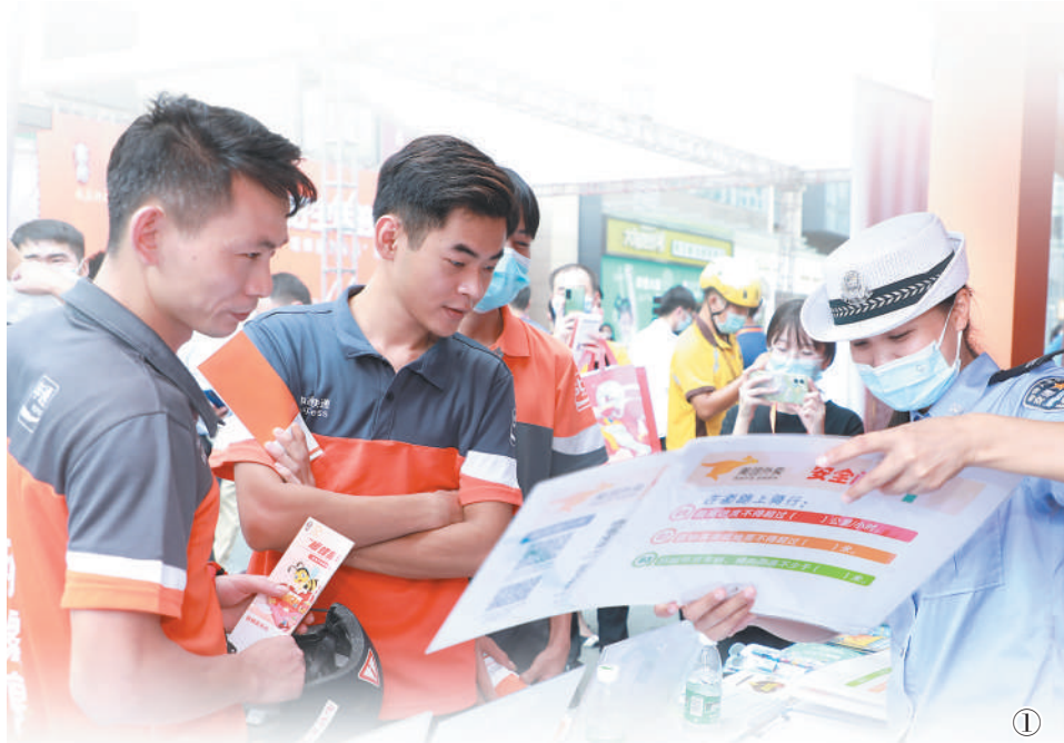
图①：深圳市公安局交通警察支队宝安大队民警向快递员小哥宣讲安全出行知识。