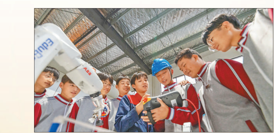
安徽省合肥市肥东县合肥理工学校智能制造实训中心,学生们在实训老师指导下学习工业机器人编程。