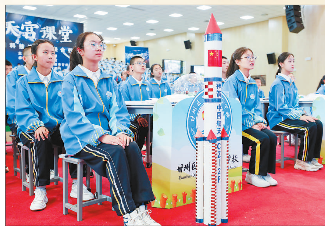
甘肃省张掖市甘州区思源实验学校的学生在收看“天宫课堂”。