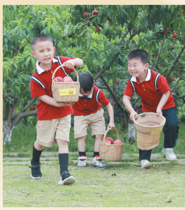
四川省成都市双流区胜利幼儿园,孩子们在参加采摘节活动。

今年以来,多地有关教育的民生实事项目陆续公布,增加托育机构、改扩建中小学学校、促进学生健康成长等成为热词,多地推出有力举措,满足群众教育需求。 习近平总书记在北京大学师生座谈会上强调:“国势之强由于人,人材之成出于学。”培养社会主义建设者和接班人,是我们党的教育方针,是我国各级各类学校的共同使命。”目前,我国教育普及程度总体上稳居全球中上收入国家行列,其中,义务教育和学前教育的普及程度达到高收入国家平均水平,高等教育进入国际社会公认的普及化阶段,劳动年龄人口的平均受教育年限达10.9年,每年全国高等学校和职业院校输送数以千万计毕业生,为全面建设社会主义现代化国家提供了重要支撑,拓展了加快建设教育强国之路。 当前,为办好人民满意的教育,全国各地正采取更加有力的举措,推动各项任务落到实处,人民群众对教育发展的获得感持续增强。 (本报记者 黄超)