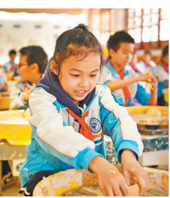
江西省樟树市临江镇中心小学,学生体验陶艺拉坯。