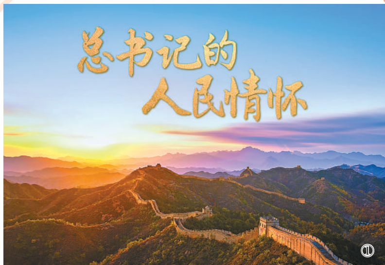
图1:3月3日起,人民日报社新闻协调部联合经济社部、政治文化部在要闻一版重要位置推出“总书记的人民情怀”系列融媒体报道,人民日报客户端在首页同步推送图文并配发微视频。这组报道既讲活故事,又体现思想,小篇幅大主题,充分展现习近平总书记深厚为民情怀和强烈历史担当,鼓舞全国广大干部群众担当作为迈开新征程。目前已刊发5组图文和视频报道,均被全网置顶推送,总阅读量近1亿次。同时,在人民日报电子阅报栏播发。