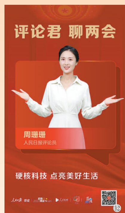
图12:人民日报社评论部、人民日报“思聊”融媒体工作室和“蓝星议事厅”融媒体工作室、人民网以及人民视频联合推出评论类系列短视频“评论君聊两会”。由人民日报评论员出镜,讲述代表委员履职故事,解读两会精神,向世界展现可信、可爱、可敬的中国形象。系列产品在相关平台传播覆盖用户超8000万,视频播放量和相关话题阅读量突破1500万次。同时,在人民日报电子阅报栏播发。