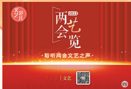
图9:3月3日起,人民日报社文艺部、人民日报“文艺范儿”融媒体工作室推出“两会艺览”系列短视频,邀请代表委员畅谈文化领域热点话题,既有专业解读也有跨界交流,受到网民广泛好评。目前,系列短视频播放量超1500万次,“两会艺览”相关微博话题阅读量超5.4亿次。