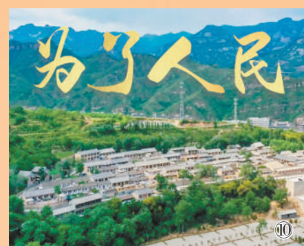
图10:两会前夕,人民日报社新媒体中心推出微视频《为了人民》,从习近平总书记在湖南花垣县十八洞村考察时与村民石拔三的一段对话切入,生动展现党的十八大以来习近平总书记和人民群众拉家常、问冷暖的感人故事。该视频在人民日报微视频频道播放量1000万次,在抖音平台播放量近8000万次,点赞276.7万。