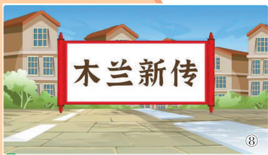
图8:在“三八”国际劳动妇女节来临之际,人民日报社政治文化部和新媒体中心合作推出动画短片《木兰新传》,紧扣两会热点话题,以花木兰“穿越”到现代社会的表现形式,生动讲述现代女性受教育权、就业权等权益依法受到保障的情况。该产品全网阅读量超过1000万次,相关微博话题阅读量达5.3亿次。