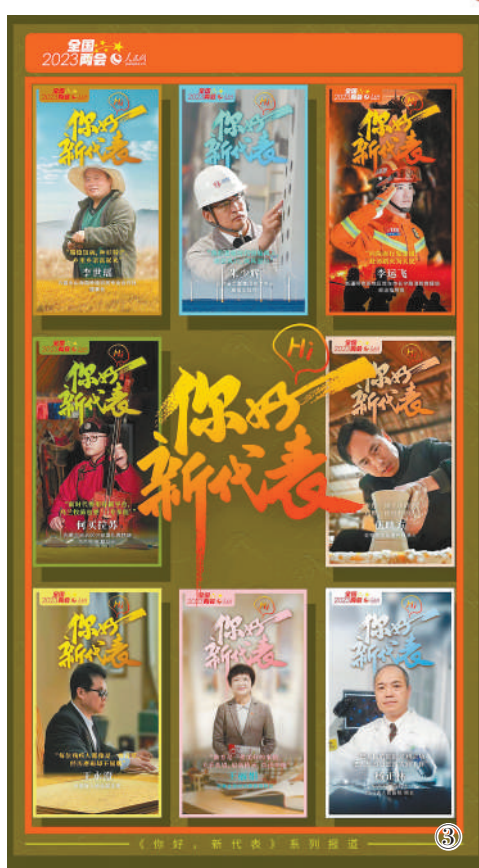
图3:3月3日起,人民网开设“你好,新代表”“你好,新委员”网络专栏,邀请来自农业、消防、文艺等领域的新一届代表委员,以“百秒vlog”形式畅谈民生活,并与网民展开互动交流。在微信平台,话题#你好新代表新委员#阅读量超4000万次;话题#他是冲在救援一线的全国人大代表#登上热搜榜,阅读量24小时内超4200万次,总阅读量超1亿次。