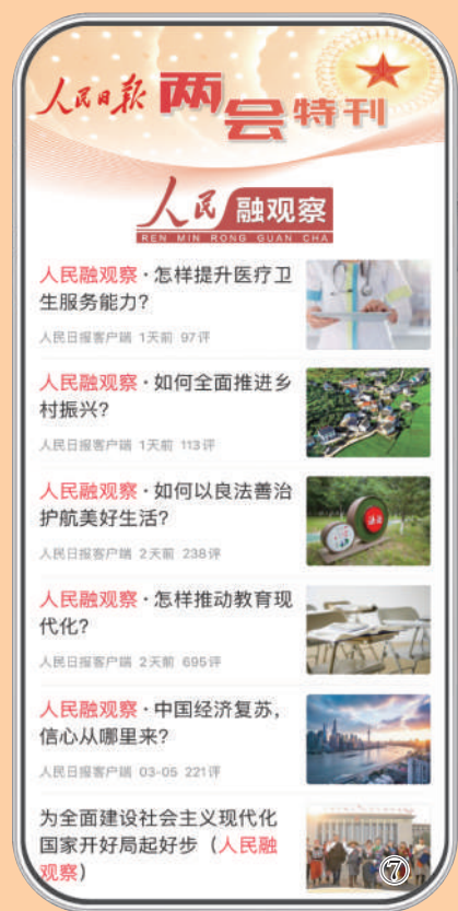
图7:3月5日开始,人民日报社新闻协调部、人民日报客户端、人民网、人民日报全国党媒信息公共平台联合推出“人民融观察”系列融媒体深度报道,聚焦两会上的中、微观热点话题,请代表委员建言、献良策、出实招,被全网热转。“人民融观察”目前已推出7期,全网阅读播放量超1亿次。