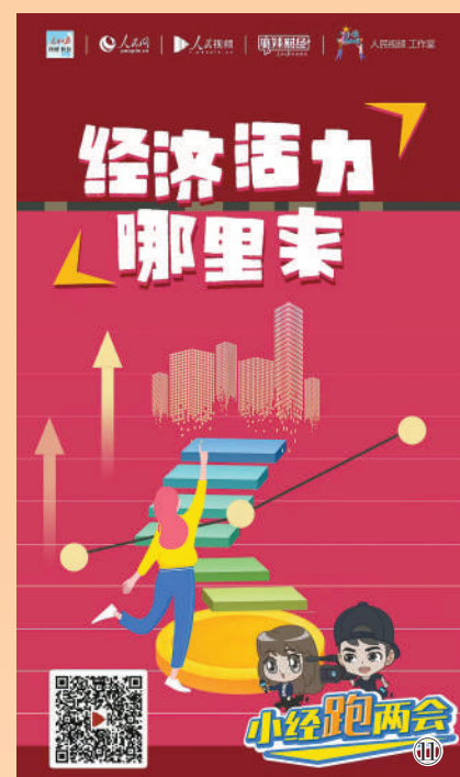
图11:3月3日起,人民日报社经济社部联合人民网、人民视频推出“小经跑两会”系列融媒体短视频产品,邀请代表委员畅谈发展热点话题,结合亮眼数据与精美画面,传递我国推动高质量发展的信心与底气。目前已刊发6期,累计传播量超3亿次,“奋进的春天”登上微博热搜榜第三名,阅读量达6100万次。同时,在人民日报电子阅报栏播发。