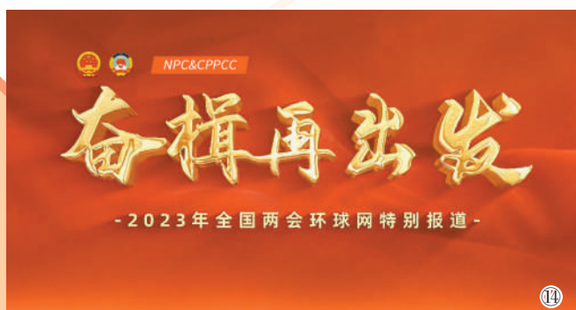
图14:环球网专题“奋楫再出发——2023年全国两会环球网特别报道”于3月3日8时准时上线。专题特别开设“启航2023”主题专区,分标签集纳两会期间有关新的一年展望、计划的重要报道,总阅读量达3000万次。