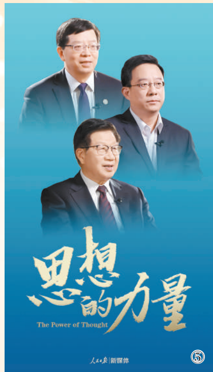
图5:人民日报社理论部、新媒体中心联合推出“思想的力量”网络公开课,围绕党的二十大报告中提出的重要思想观点、重大战略举措,制作推出系列视频。该产品全网阅读量超1亿次,“思想的力量”公开课#中国共产党的底气#未来中国什么样#等多个话题登上微博要闻榜。