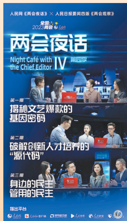
图6:人民日报社总编室和人民网合作推出“两会观察”“两会夜话”对话类融媒体栏目,邀请代表委员与专家学者、一线工作者互动交流,谈履职、话体会。“两会观察”栏目在人民日报要闻版推出,以深度采访和“观察手记”形式解读热点、回应关切。人民网“两会夜话”栏目同步推出视频,与版面文字报道相得益彰,视频播放量超4200万次。