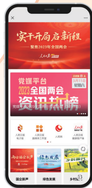
图13:人民日报全国党媒信息公共平台推出“实干开局启新程”智能信息流产品,联合全国千家党媒、机构共建优质内容池,用主流价值导向驾驭智能算法,为301家媒体、机构“度身定制”两会资讯个性化推荐频道。