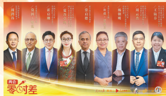
图4:2月28日起,人民日报社国际部联合人民网、人民视频、山东广播电视台推出“两会零时差”多语种融媒体系列访谈节目,聚焦“中国式现代化”“一带一路”“科技创新”“乡村振兴”等两会热词,打通国内国际两个舆论场,邀请代表委员、有关国家驻华大使等共话两会、共叙发展,累计播放量超3亿次。