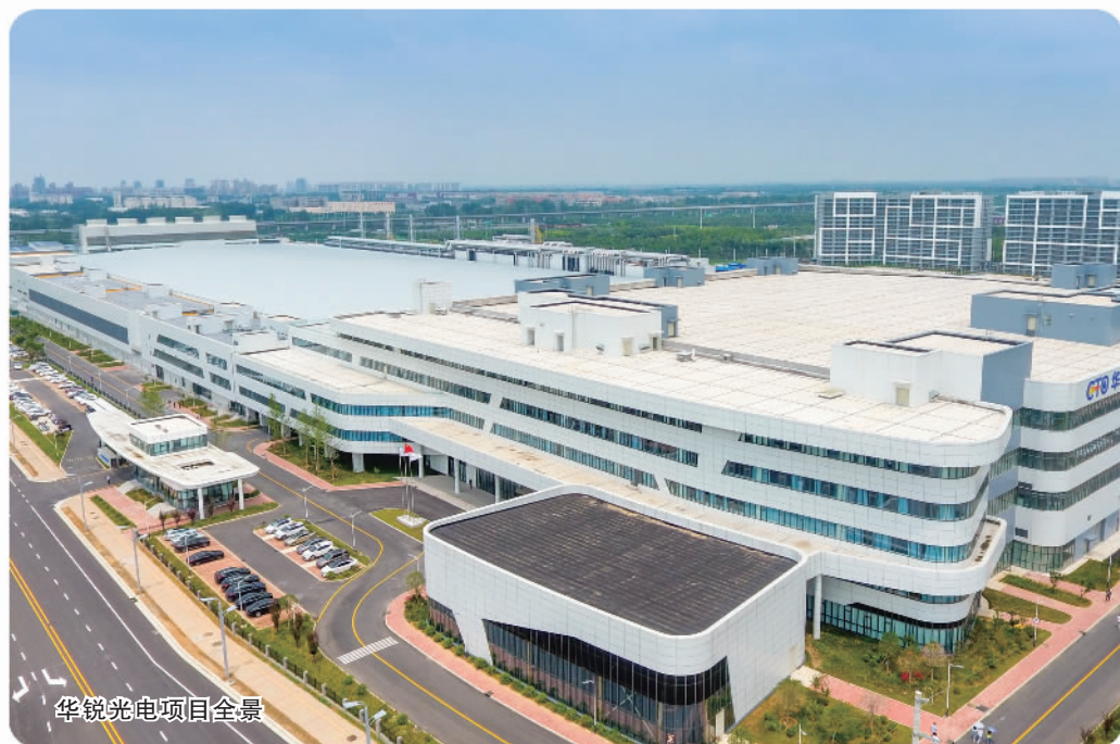
华锐光电项目全景

近年来,河南郑州航空港“优势再造抢抓新赛道、创新驱动培育新动能”,加快发展航空物流、电子信息、航空航天、生物医药、新能源汽车、现代服务业六