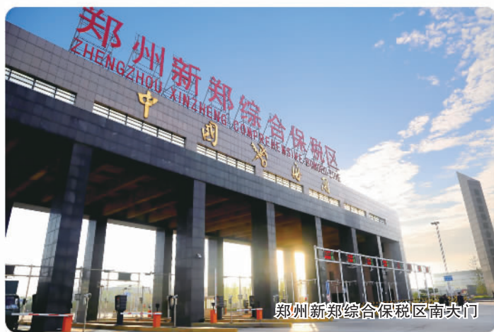
郑州新郑综合保税区南大门

2022年4月,河南省委、省政府对河南郑州航空港进行系统性重塑性改革,赋予其“中原经济区和郑州都市圈核心增长极”新定位,“现代化、国际化、世界级物流枢纽”新目标,“全国航空经济发展的顶梁柱、制度型开放的排头兵”新要求。站在新起点上,河南郑州航空港开启“二次创业”奋斗新征程。