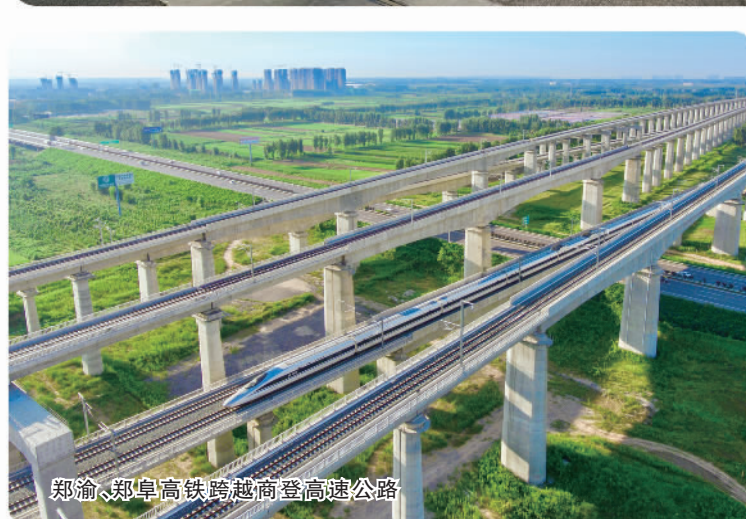
郑渝、郑阜高铁跨越商登高速公路