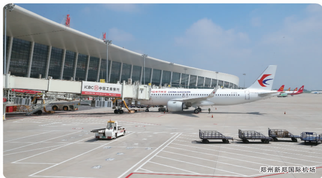
郑州新郑国际机场

河南郑州航空港经济综合实验区由郑州航空港区演变而来,2012年到2022年,地区生产总值从206亿元增长至1208亿元,年均增长14.1%;工业总产值从1252亿元增长至5358.4亿元,年均增长17.2%。综合保税区进出口总量位居全国第2位,郑州机场航空货邮吞吐量达63万吨,货运规模居全国第6位,跻身全球货运机场40强。