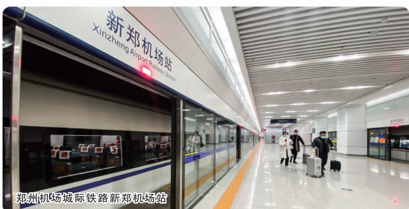
郑州机场城际铁路新郑机场站