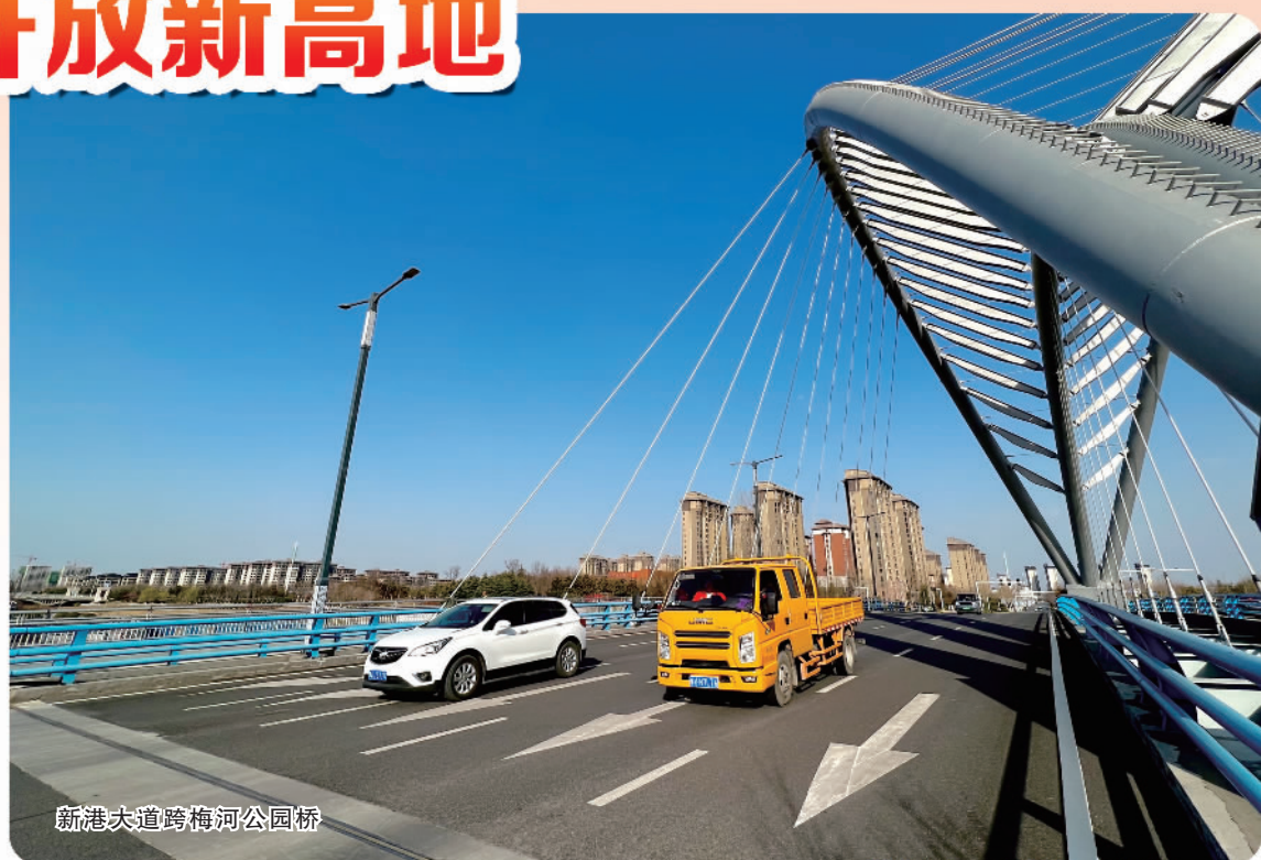
新港大道跨梅河公园桥