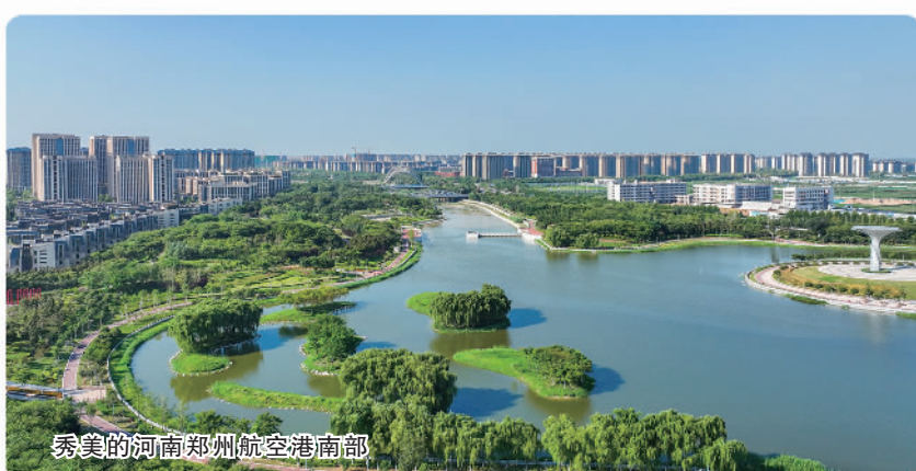
秀美的河南郑州航空港南部